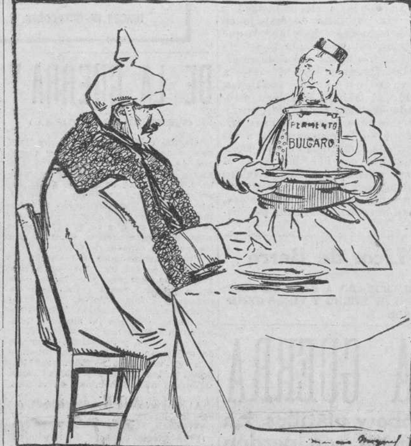
Buen vigorizante es ese que va a tomar el Kaiser!