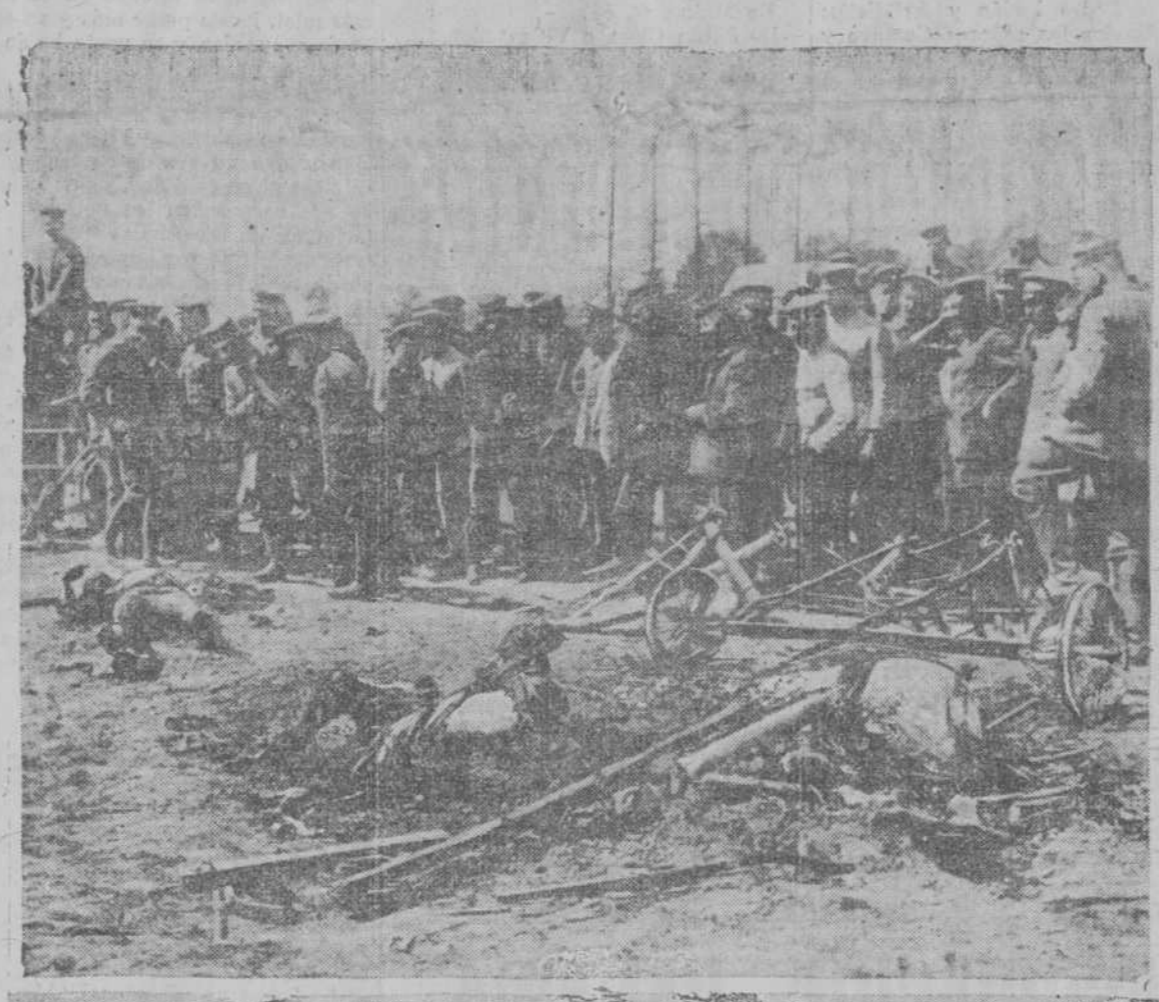
LOS EFECTOS DE UNA BALA EN UN AEROPLANO.—Esta interesante fotografía muestra los efectos causados por una bala alemana a un aeroplano de guerra inglés, donde fallecieron dos aviadore, los cuales murieron a consecuencia del fuego que dicha bala produjo en la nave aérea. Los alemanes enterraron a los aviadore ingleses con todos los honores correspondientes. Esto ocurrió cerca de Ipres.