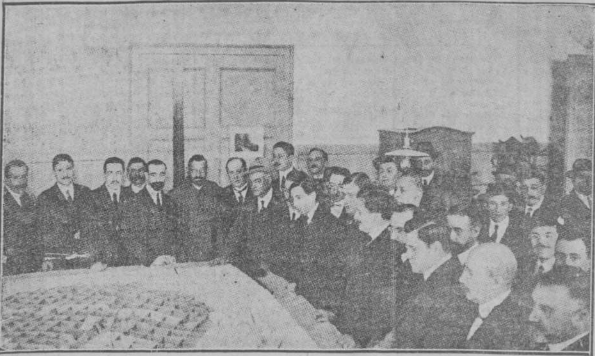
El Comité de la Exposición explicando a los invitados los pormenores de la misma sobre un plano en relieve de una fotografía que nos ha facilitado el delegado general en Cuba de la "Sociedad de Atracción de Forasteros de Barcelona."

Barcelona.-La futura Exposición Internacional de Industrias Eléctricas.