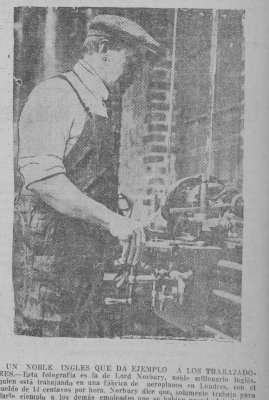
UN NOBLE INGLÉS QUE DA EJEMPLO A LOS TRABAJADORES.—Esta fotografía es la de Lord Norbury, noble millonario inglés, quien está trabajando en una fábrica de aeroplanos en Londres, con el sueldo de 14 centavos por hora. Norbury dice que, solamente trabaja para darle ejemplo a los demás empleados que se habían negado al trabajo.

Nos alegramos de la actitud adoptada por los Bomberos, pues con ello prueban una vez más sus desinteresados servicios y que siguen dispuestos a cumplir el deber de resguardar a la ciudad de cualquier conflagración.