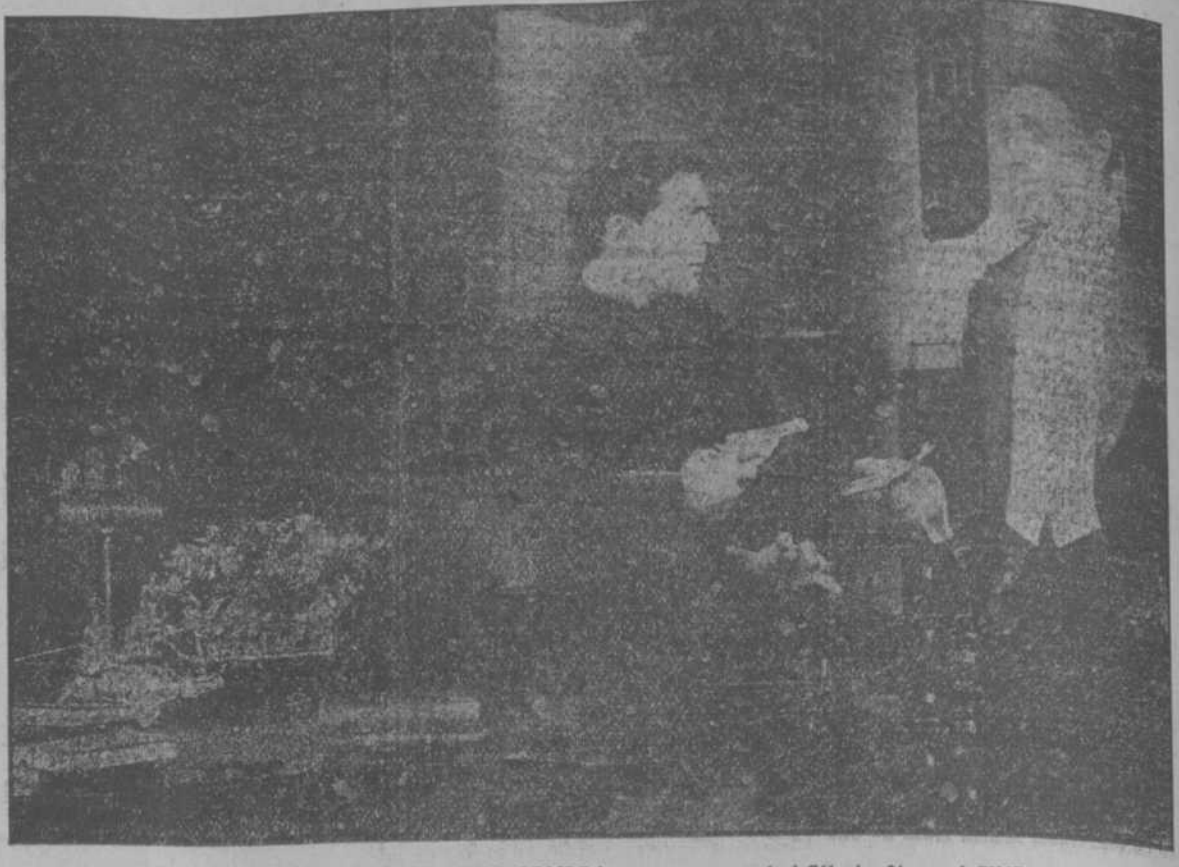
Una escena de la película LOS BANDIDOS DE LA SOMBRA, que se estrenará el Sábado, 24, en el CINE GALATHEA. C. 1765 11-22 2d-23

PARA LOMBRICES EN NIÑOS Y ADULTOS TOMEN VERMIFUGO DE B. A. FAHNESTOCK EL MEJOR REMEDIO CONOCIDO EN EL MUNDO B. A. FAHNESTOCK CO. PITTSBURGH, PA., U. E. DE A/