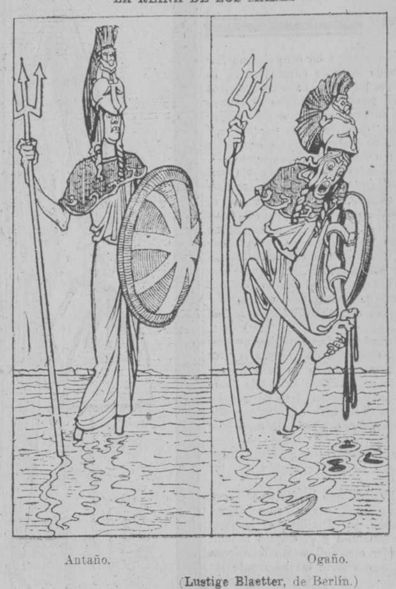
Antaño. Ogaño. (Lustige Blaetter, de Berlin.)