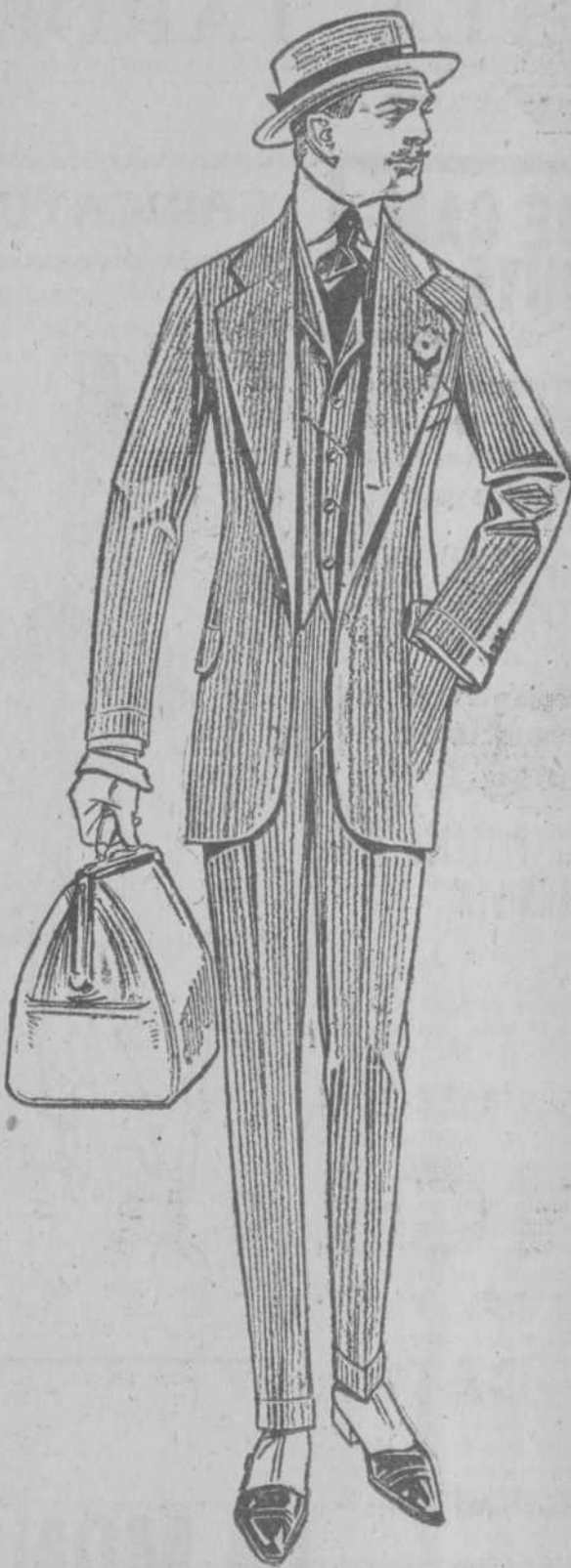
Remitimos gratis a provincias nuestro catálogo ilustrado.

Por su condición social, necesita ser apreciado en lo moderno y elegante de su traje por la opinión ajena, y es celoso, además, de su buen gusto, vístase con nuestros sastres, que han merecido la aprobación de esta sociedad elegante, y de nuestras telas, que no reconocen competencia en este ambiente. Continuará siendo, o empezará a mostrarse, un hombre distinguido.