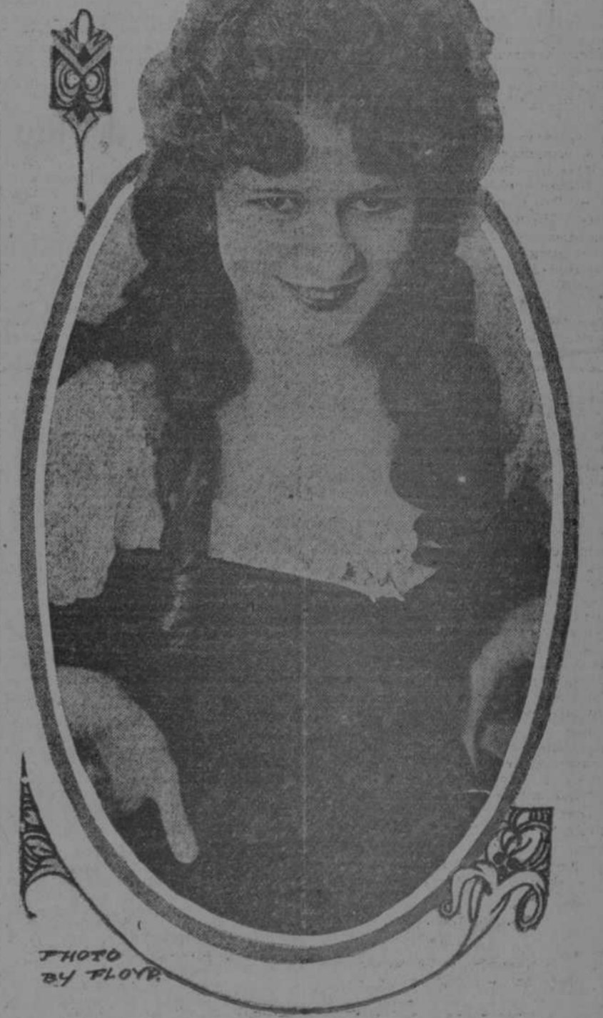
Último retrato, en carácter, de la famosa actriz de comedia, Anita Stewart, la que tiene en proyecto una "tournee" por la América del Sur...