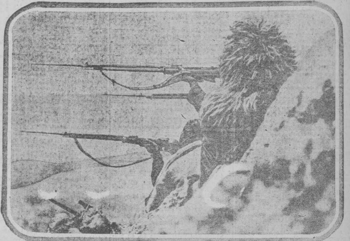
Un regimiento de soldados montenegrinos que tanto se están distinguiendo en la presente campaña contra Austria, y que para resguardarse del espantoso frío reinante en esas latitudes han ideado un abrigo de piel de carnero.