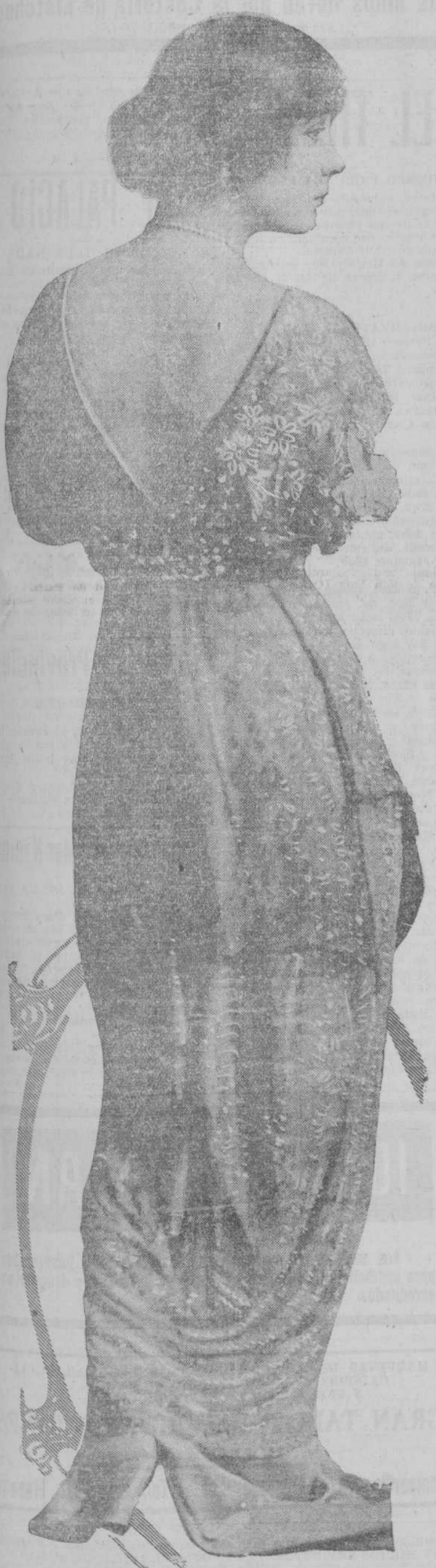
LA ELEGANTE Y BELLA ACTRIZ NEYORGINA MARGARITA SLLINGTON EN LA OBRA "LA MENTIRA."

Diálogo entre enamorados: —¿Es decir que te fias de mi palabra? —Sí, con absoluta confianza.