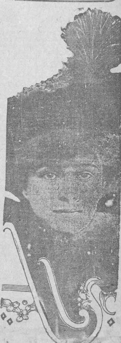
UNA VIREINA AMERICANA. — La Condesa de Granard, americana de nacimiento, cuyo esposo, el Conde de Granard, será nombrado con toda probabilidad Virey de Irlanda para suceder al Conde de Aberdeen.