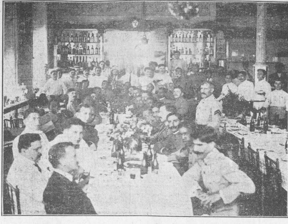
Cañé, restaurant y Dulceria "La Norma" Camagüey. Recuerdo fotográfico de un banquete reciente.