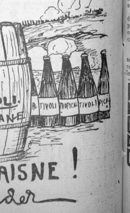
CERVEZAS TROPICAL y TIVOLI POR-QUE-ME-SALVE-EN-AISNE! Max Sinder

Taboada y Rodríguez Cienfuegos, 9 y 11. Tel. A-2801. Importadores de efectos sanitarios. 17,240 alt.