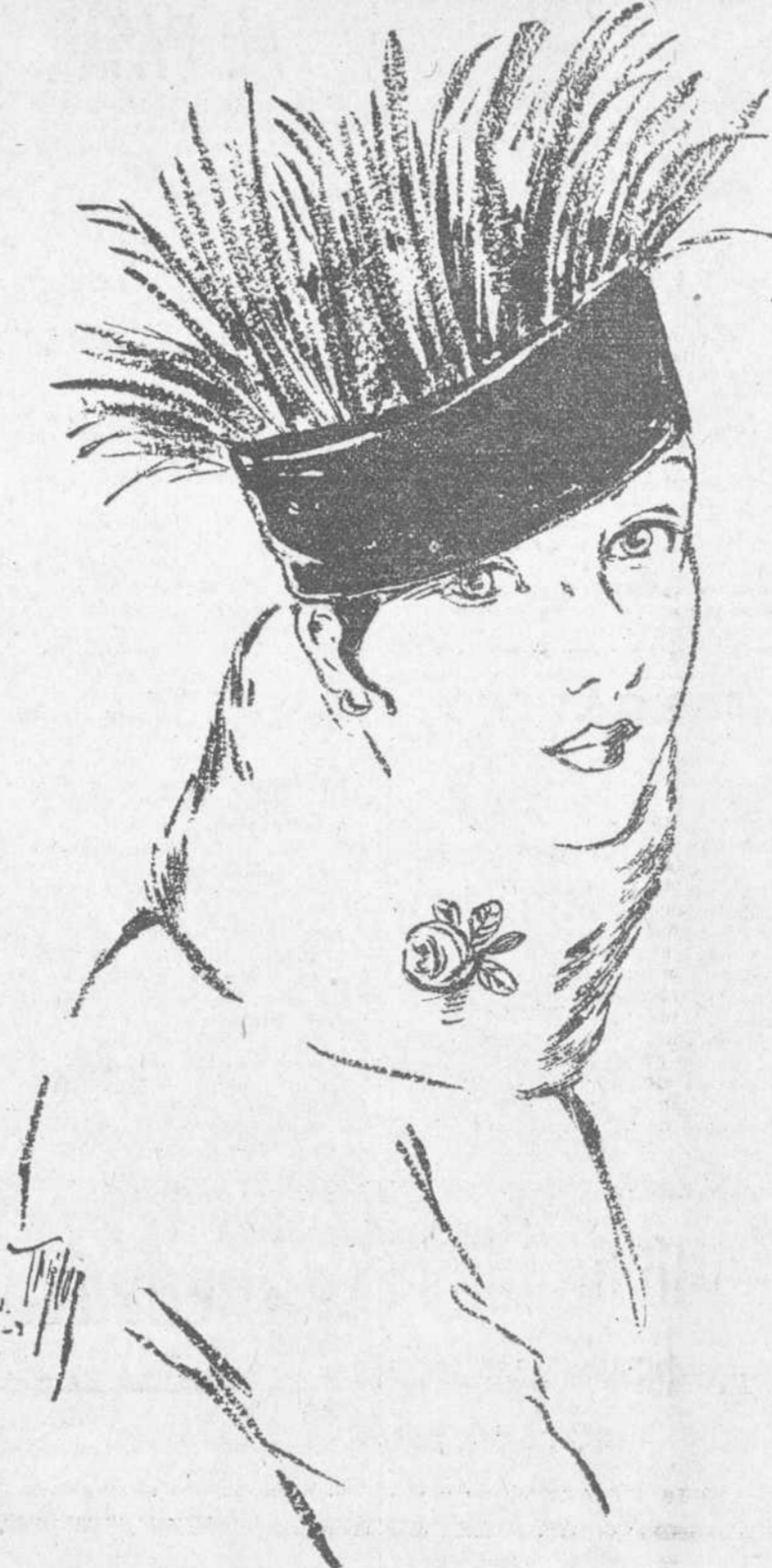
La rosa, prendida hasta hace poco, en la "solapa" de los trajes de mujer, ha subido un poco más; y luce ya, actualmente sus colores, no por artificiales menos brillantes...