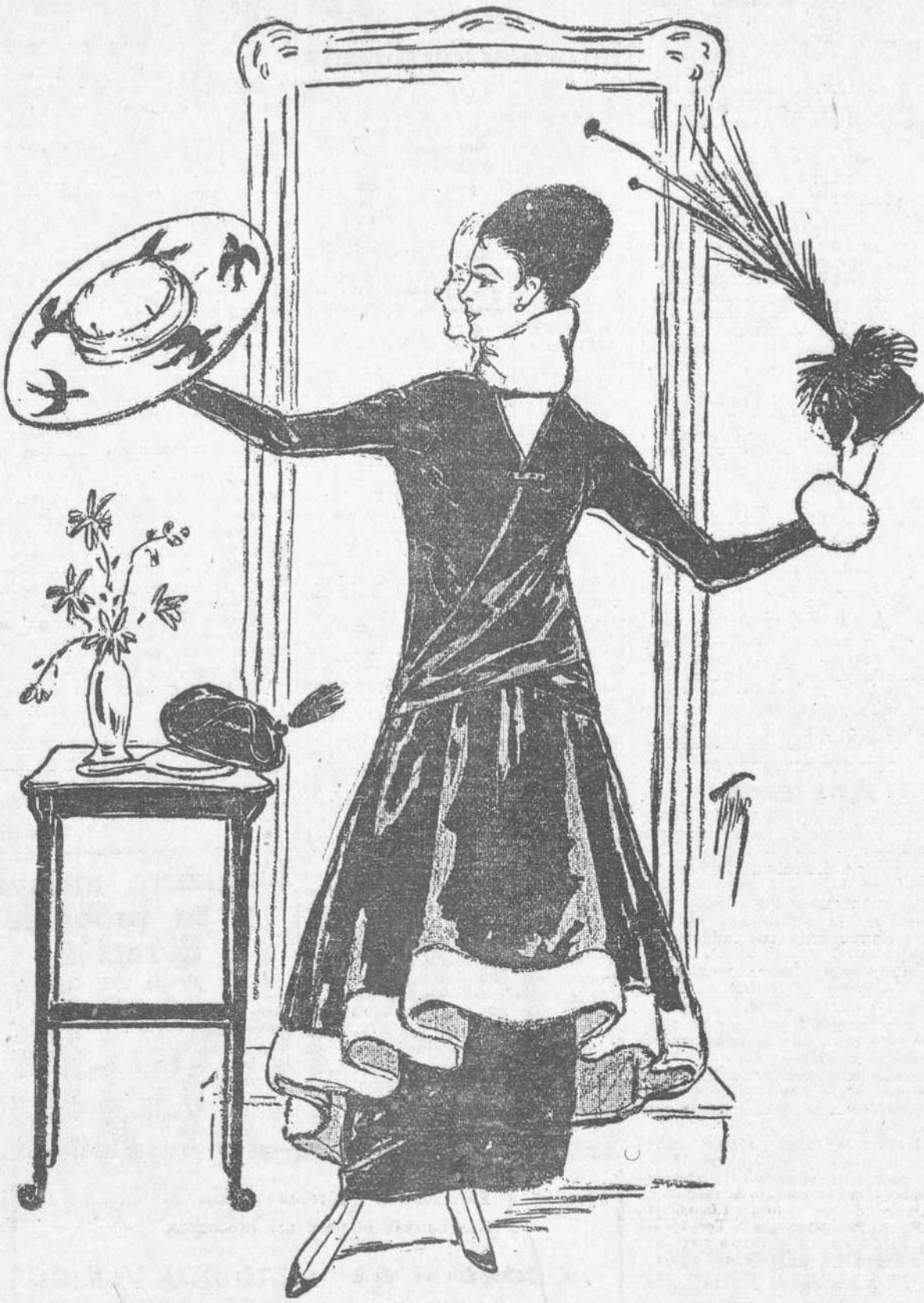
LOS SOMBREROS DE MODA.—¿Son grandes? ¿Son pequeños? No hay un tamaño definitivo. Predominan los modelos reducidos, pequeños. Pero ha comenzado una tendencia, cada vez más marcada, de ir cediéndole el paso a lo de forma grande. La sencillez de los adornos es su fundamental. Sólo una flor. Un lazo. Y a veces, como en éste del diseño, un "sprit" sencillísimo. Pero las plumas están en desuso. (Modelo Mc. Clure)