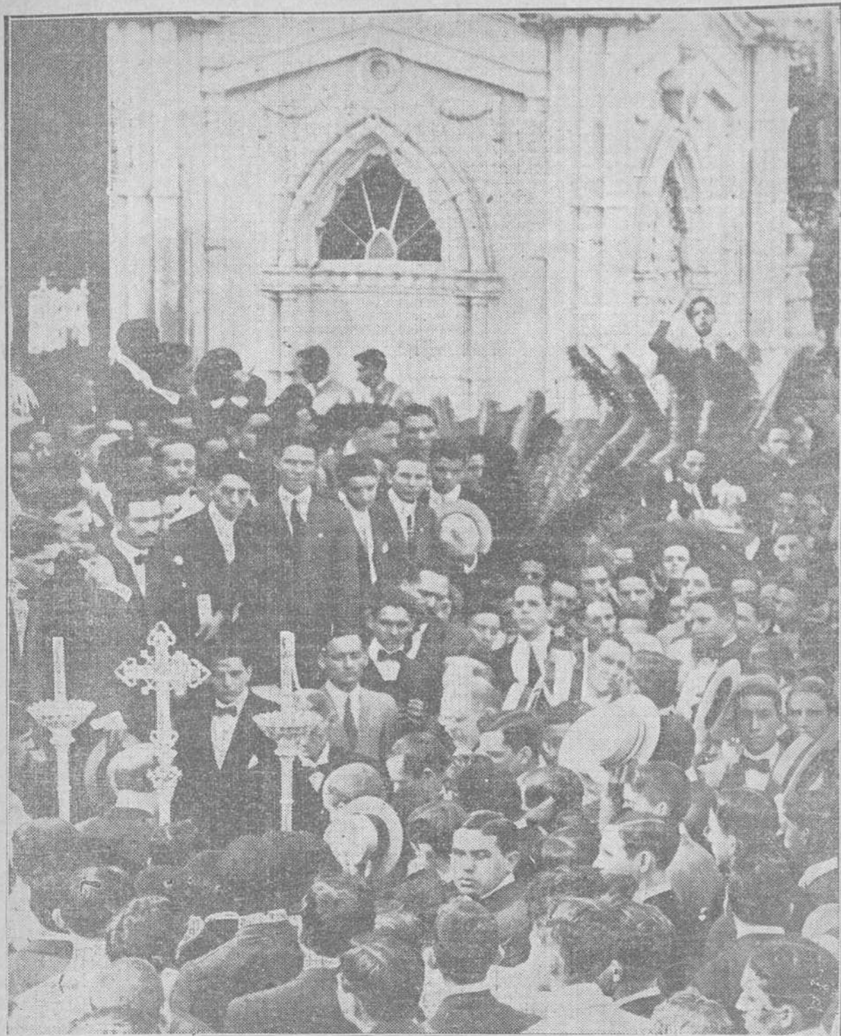
EL SEÑOR OBISPO DE LA HABANA REZANDO UN RESPONSO ANTE LA TUMBA DE LOS ESTUDIANTES