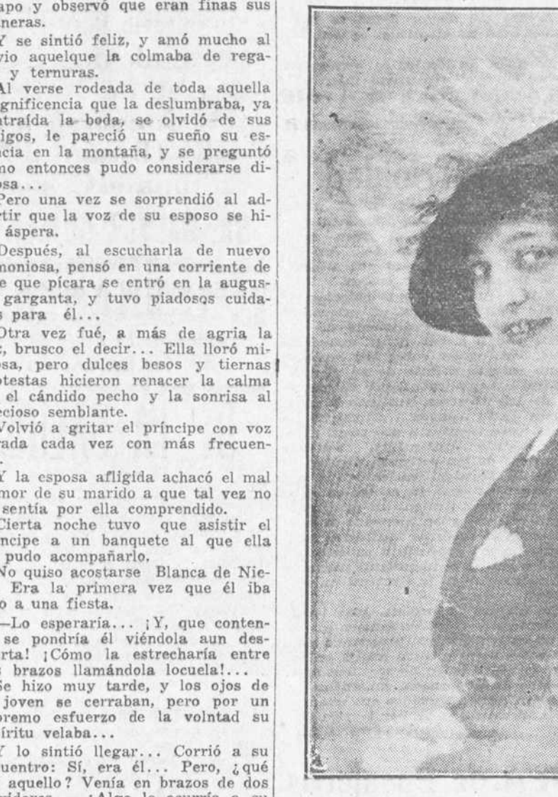
SOMBRERO PARA INVIERNO EN TERCIOPELO, GUARNECIDO DE "EROSSES."