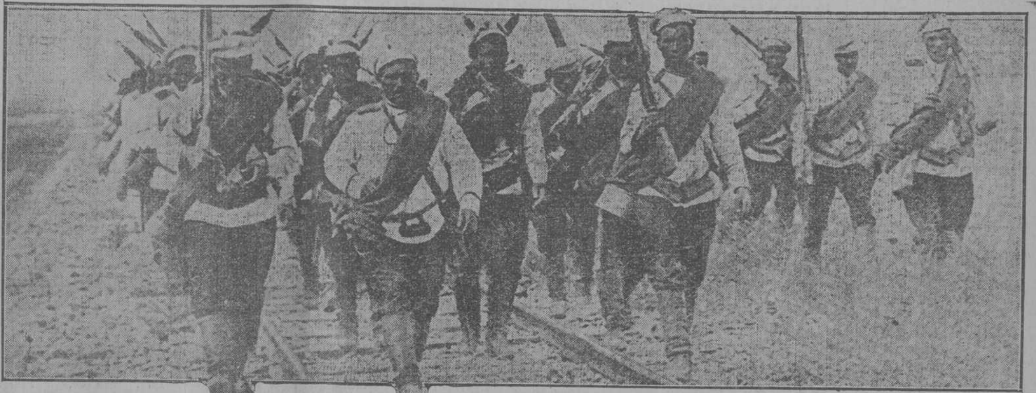
SOLDADOS DE INFANTERIA RUSA AVANZANDO POR LA LINEA DEL FERROCARRIL.

Londres, 27. El corresponsal en Bolonia del "Daily Mail" de esta ciudad dice que los acontecimientos de los últimos días