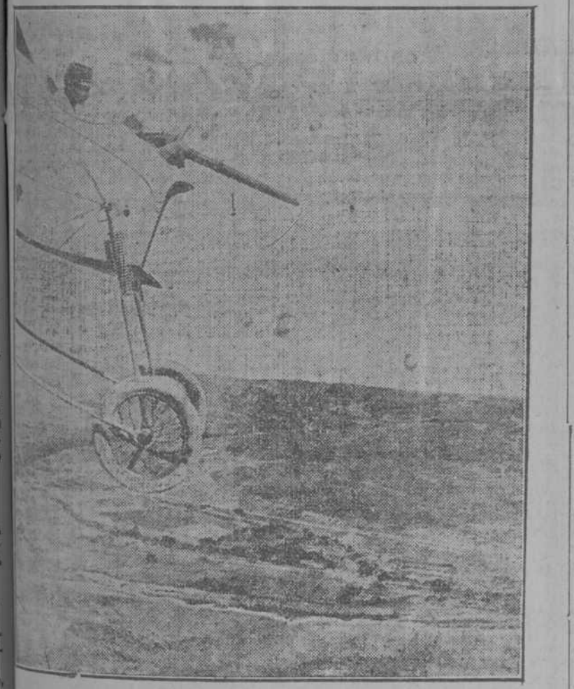
LA GUERRA EN EL AIRE