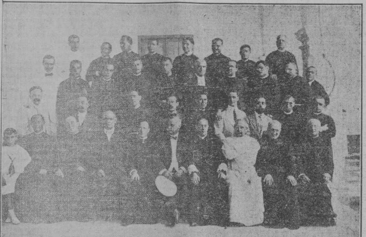
LA COMUNIDAD E INVITADOS, EN LOS CLAUSTROS DEL COLEGIO

El magnífico edificio que ocupan en Guanabacoa los P. P. Escolapios cambió ayer de aspecto. Al silencio augusto que invita a la meditación, más acentuado que nunca con motivo de las vacaciones, sustituyó ayer la mayor animación y alegría... Temprano las campanas congregaron en el templo a buen número de fieles, quienes, devotos de San José de Calasanz y admiradores de su obra, esa obra que con sumo brillo continúan los P. P. Escolapios en Guanabacoa, en el Cerro, en el corazón de la Habana, en la calle de San Rafael, fueron a orar correspondiendo a la invitación que el alegre repiqueteo de las campanas les hacía.