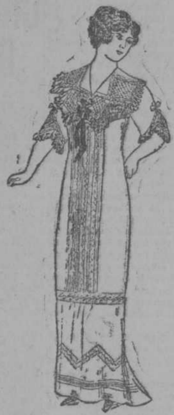
Linda bata de nansú francés con adornos de tul bordado y finos encajes y entredoses. Un Luis.