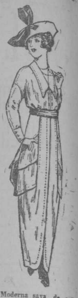
Moderna saya de ratón blanco $3.50.