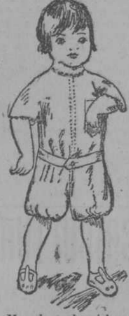
Mameluco de vichy con festón o cuello de 2 a 5 años, 40 centavos.