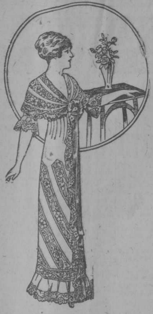
Elegante y moderna bata de nansú francés y finos encajes a $6.98.

Espléndido surtido en vestidos blancos y de fantasía, con vuelones y todos los detalles de la moda.