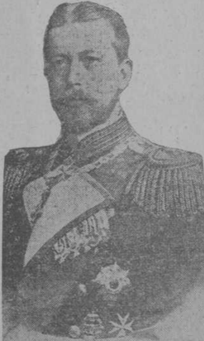
El Príncipe Enrique de Prusia, hermano del Kaiser, Gran Almirante de la flota alemana.