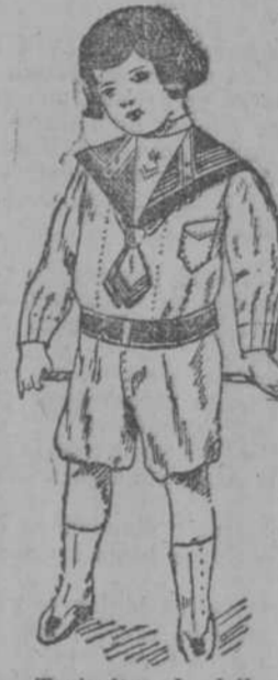
Trajecitos de dril blanco con adornos azul y punzó, de 2 a 10 años, desde $2.48.