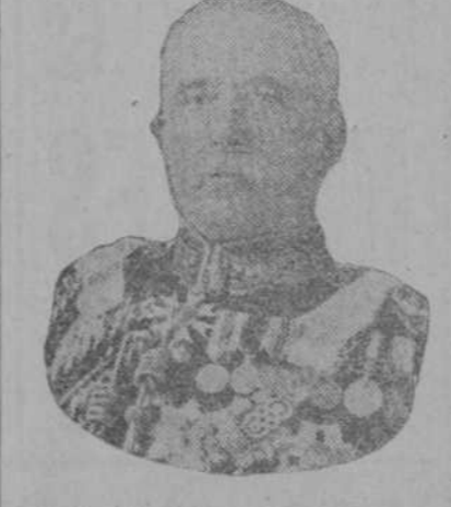
El Capitán General del Ejército expedicionario inglés, Sir John French, que acaba de desembarcar en Francia y se halla en campaña al frente de 125.000 ingleses.