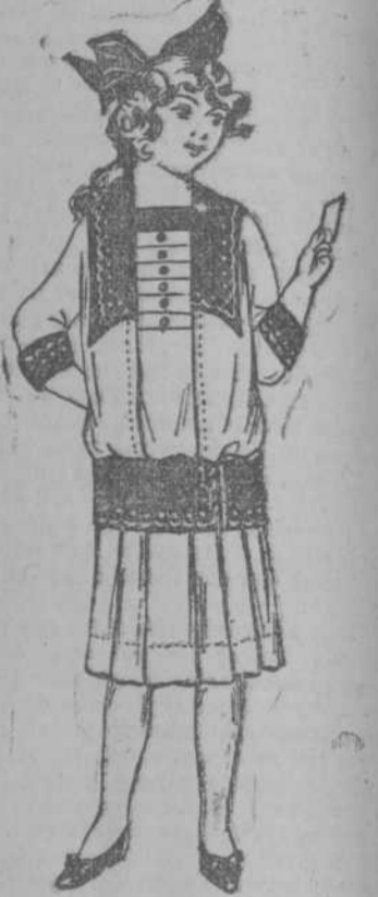
Vestido, forma moderna, de warandol blanco, con adornos tela de color, con bordados y festones. Desde $1.98 para 8 años.

ABIERTO LOS SABADOS HASTA LAS DIEZ DE LA NOCHE. Los Tranvías Pasan por Delante de Estos Almacenes.