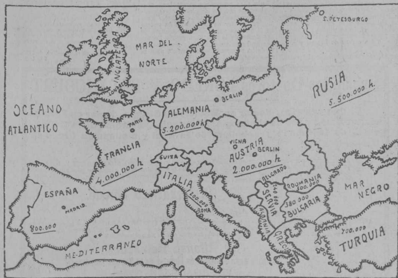
Demostración gráfica de los contingentes militares de Europa.