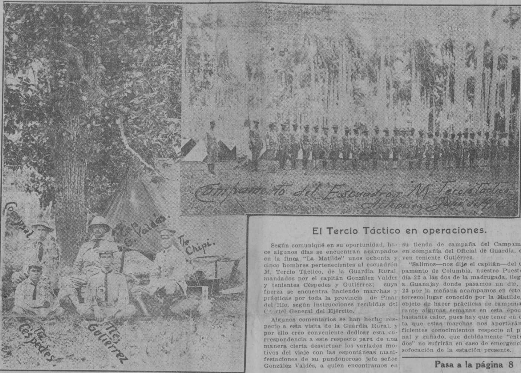
El Tercio Táctico en operaciones.