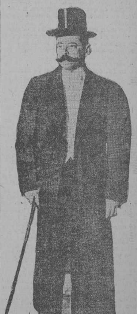
El Ldo. Carbajal, actual Presidente de Méjico.