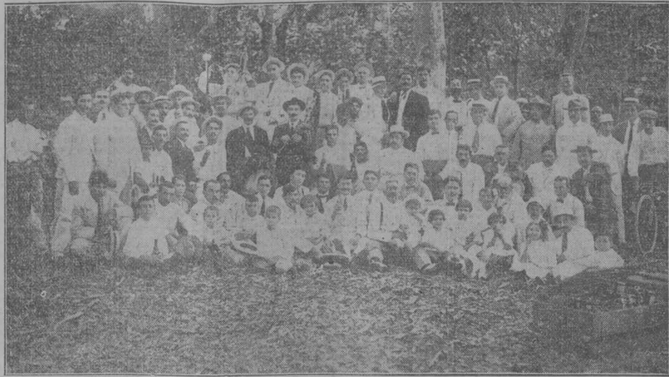
La colonia gallega en Colón: grupo de concurrentes a la brillante y reciente fiesta celebrada.