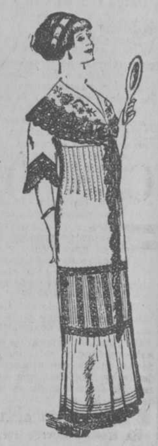
Elegante bata de nansú francés con gran cuello bordado y anchos encajes, $5.30.