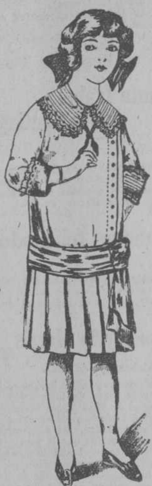
Vestido de piqué de cordón ancho. Adornos de voile de seda y plises de tul. Para 8, 10, 12 y 14 años.—Desde $2.50.