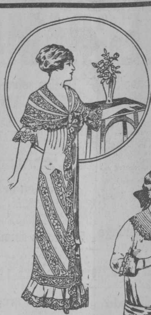
Elegante y moderna bata de nansú francés y finos encajes, a $6.98.