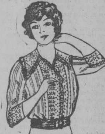
Linda blusa de Nansú sedoso, combinado con fina guarnición bordada y encajes Valencianas. Para reclamo, a $1.70.

Sábanas cameras con dobladillo de ojo, a $ 2-03, fundas, a 25 centavos.