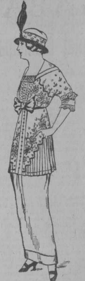
Un modelo de nuestra colección de vestidos finos. Es de Marquisetti bordado, con volante plegado, $26.50.