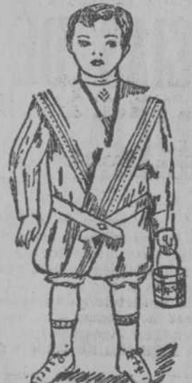
Trajecitos para niños de todas edades. En warandol, piqué o driles de primera calidad.—Desde $1.50.