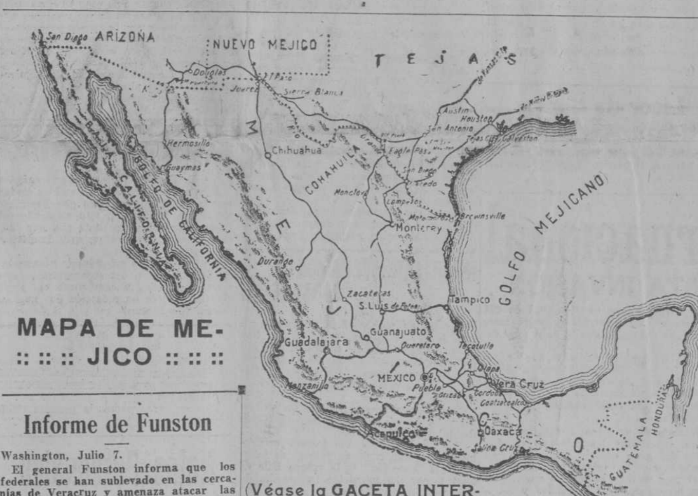
MAPA DE MEXICO

Informe de Funston Washington, Julio 7. El general Funston informa que los federales se han sublevado en las cercanías de Veracruz y amenaza atacar las avanzadas americanas. Agrega Funston que el jefe de los federales le ha notificado que ese ataque, si se efectúa, no debe considerarse como ordenado por los hueristas.