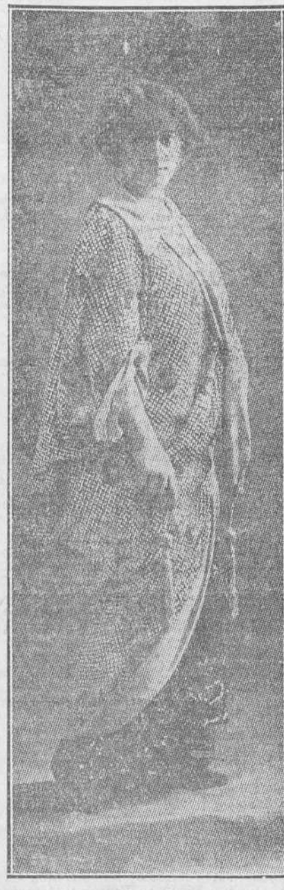
MANTEAUX EN SATEN BROCHADO

¿DE QUE PROVIENE LLAMAR "CACOS" A LOS LADRONES?