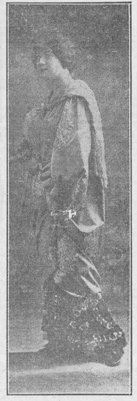
OTRO MANTEAUX TAMBIEN BROCHADO

Cómo se conserva la piedra en equilibrio, es un misterio que no se ha aclarado hasta ahora. La región es muy visitada por turistas que acuden exclusivamente a verla curiosa piedra.