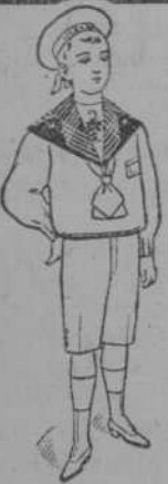
Dril blanco, con los cuellos de o-man, blanco, punzó y azul, precio: $ 3-25, uno.