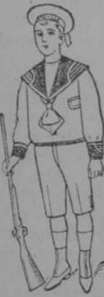
Dril blanco, para todas las edades, precio: $ 3-60, uno.