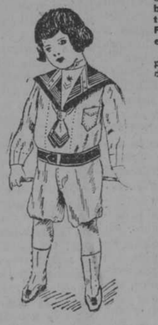
Trajecitos de drill superior, con adornos prusia o punzó, para 2, 4, 6, 8 y 10 años. Desde $2-68, según edad.

MATINES Nuevo y moderno surtido, desde 98 centavos.