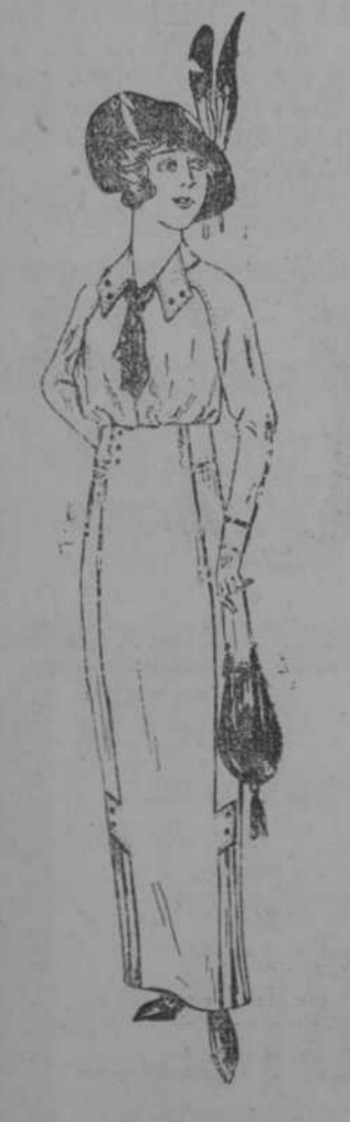
Nuevo vestido de Vichy punzó o prusia, adornos otomán blanco y corbata de seda negra para señora y jovencita a $ 1-98.

SABANAS con dobladillo de ojo, cámaras, a 98 cts. Fundas a 25 centavos.