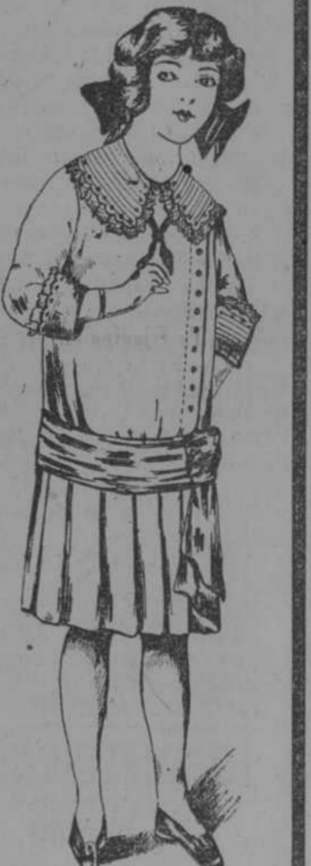
Vestido de moderno piqué de cordón, ancho cuello, banda y puños de volú festonado y bordado con seda. Plisés tul y botones strass en rosa, azul beige y blanco. $ 3-50 para cuatro años y 25 cts de aumento por edad.

Elegante combinación muy adornada de finos encajes, a $ 4-50.