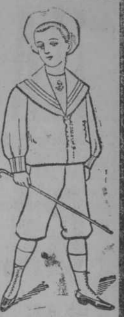
Dril color, precio: $ 1-15. Dril blanco, precio: $ 2-25.