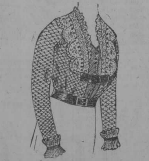
Elegante blusa de broderie crema con chaleco de Otomán de color. Encajes Valencienes y plisés de tul. $ 3-98.

Elegante combinación muy adornada de finos encajes, a $ 4-50.