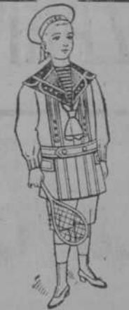
Dril blanco, precio: $ 2-80. Dril color, precio: $ 2-00.