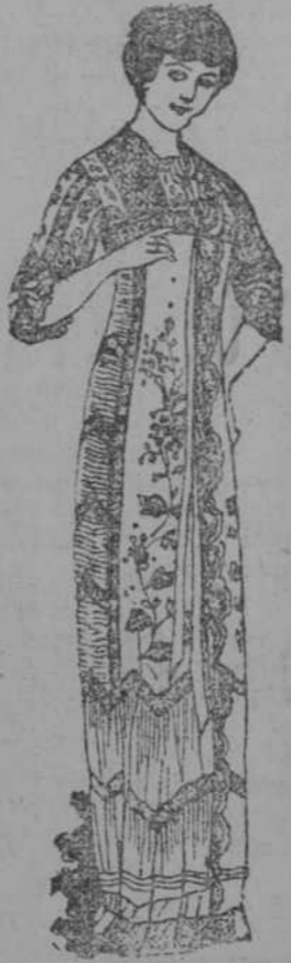
EN BATAS hay primores, desde $ 2-00 una, hasta $ 31-80, una. CORTES MUY ELEGANTES.

EN PERFUMERIA NO DETALLAMOS PRECIOS, PORQUE TODA LA ESTAMOS LIQUIDANDO A PRECIOS DE FABRICA