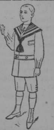
Dril blanco, con los cuellos blanco, punzó y azul, colores firmes, precio: $ 4-00, uno.