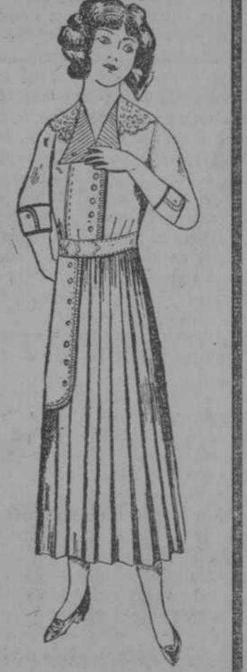
G. 292. Vestido de Vichy azul o punzó. Adorno piqué blanco y cuello fino. Parr 10 años $2-10. " 12 " $2-20. " 14 " $2-30. " 16 " $2-40.

MATINES Nuevo y moderno surtido, desde 98 centavos.