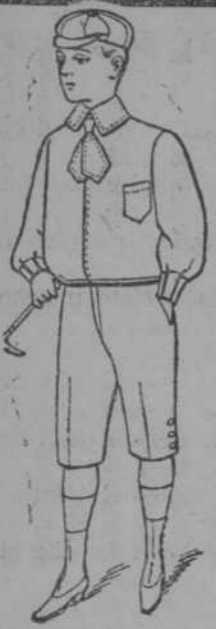
Dril color, para todas las edades a 90 cts. uno y dril superior blanco, precio: $ 2-00, uno.

LE PASARA IGUAL QUE A LAS FLORES. LAS FLORES SE MARCHITAN PASADOS UNOS DIAS Y USTED PERDERA ESTAS GANGAS SI NO APROVECHA PRONTO ESTA OPORTUNIDAD.