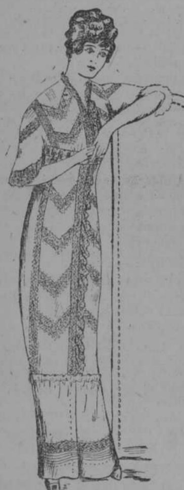
Elegante y moderna Bata de nansu francés y finos encajes. UN CENTEN

Elegante vestido de última moda para señoras y jovencitas en blanco y géneros de fantasía.