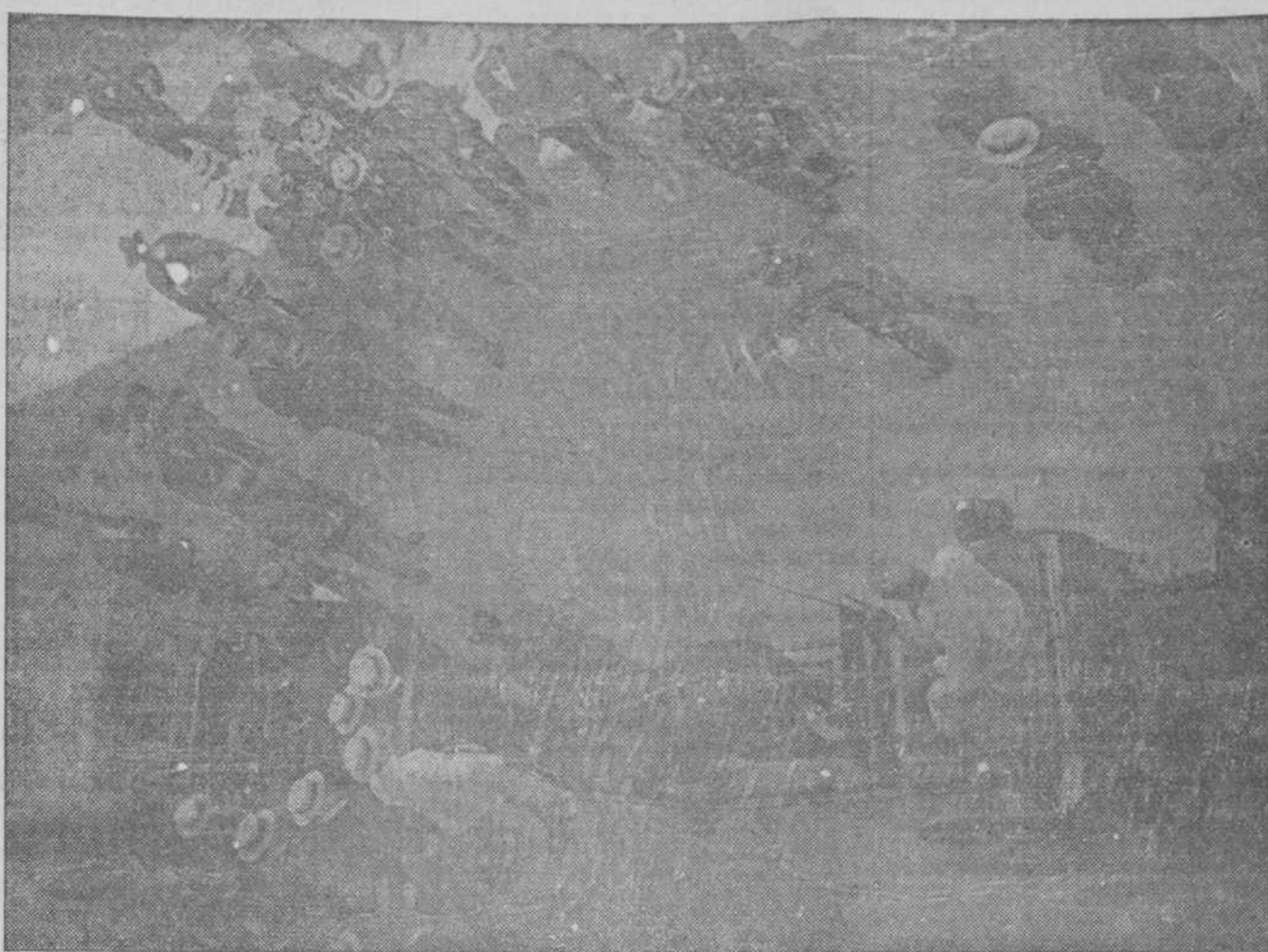
El lugar de la escena a vista de pájaro.—La policía invitando a los procesados a situarse en sus puestos.

Ambos coinciden en sus declaraciones. Se apeó primero el general Asbert del automóvil dirigiéndose al cohe.