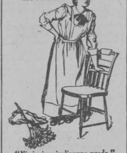
"Ni siquiera inclinarme puedo."

humor y nerviosa; le ocasiona desvanecimientos, dolores reumáticos, neuralgia, jaqueca y decadencia de la vista. Las Píldoras de Foster para los Riñones han traído nueva vida y fuerza á millares de mujeres achacosas y son un compuesto de ingredientes medicinales puros. No contienen droga alguna arriesgada ni narcóticos ni nada que conduzca á enviar al que las usa, Curan los dolores dorsales; las afecciones de los riñones y vejiga y el llamado mal hábito en los niños de humedecer la cama.