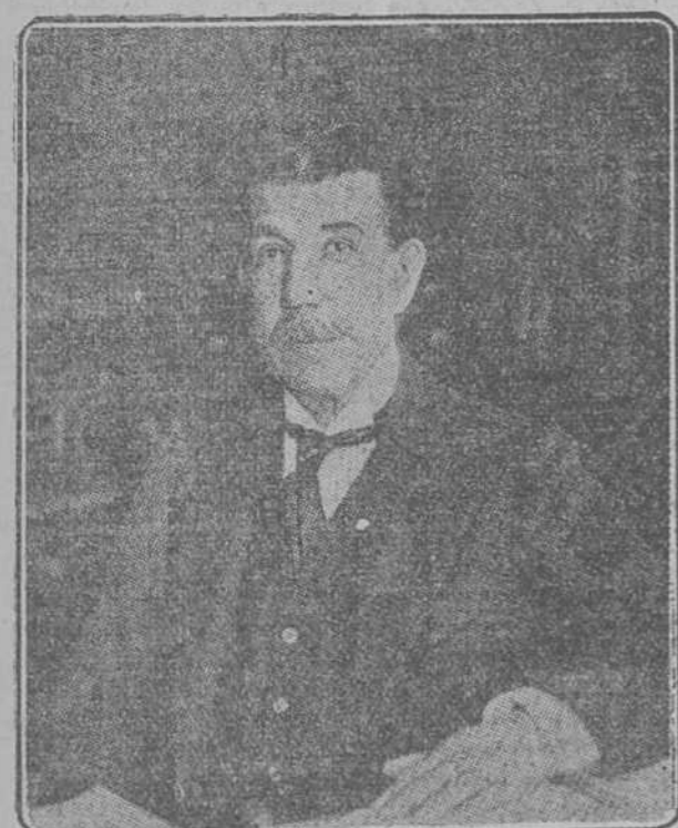
EXCMO SEÑOR DON FRANCISCO BERGAMÍN, Ministro de Instrucción Pública, a quien sus aciertos e importantes reformas, al frente de su Departamento, le han colocado en el primer lugar de los señores Gabinetes.