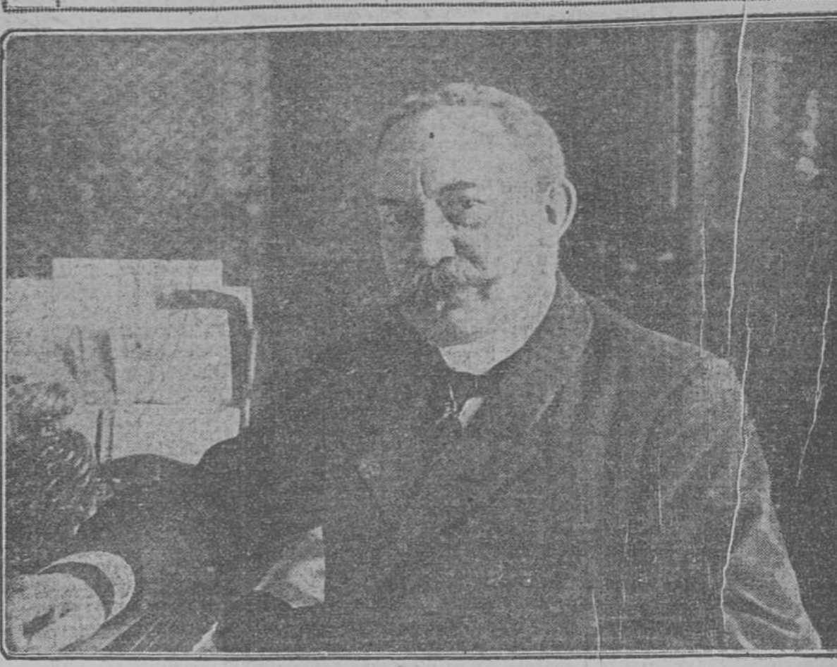
Excmo. Sr. Don Javier Ugarte, Ministro de Fomento

El señor Ugarte honra a Turismo Hispano-Americano con su opinión valiosísima. Su ofrecimiento de cooperación oficial a nuestro trascendental cometido, es tanto más de estimar cuanto que es la promesa de un político de tanto talento y competencia, que bien puede ser el un maestro en nuestros afanes y en nuestra obra. El actual ministro de Fomento es una figura de relieve en nuestra historia, cuyos destinos bien pudieran condárselo en tiempo no lejano.