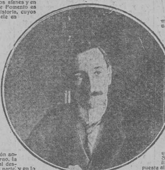
Excmo. Sr. Vizconde de Lx, Alcaide de Madrid

Hablar del desarrollo del turismo entre nosotros, es hablar de la reconstrucción de España; es estimular el engrandecimiento, es fomentar sus intereses morales y materiales. No se exhibe ante los extranjeros sin procurar engrandecerse por cuantos medios están a su alcance. Las relaciones internacionales tienen exigencias cuya realización contribuye siempre a provechosas expansiones de los pueblos. Y esas relaciones se cimentan y prosperan, más aún que desde las altas cumbres de la diplomacia, promoviendo el acceso de unos a otros pueblos, mediante las facilidades creadas al amparo del conocimiento mutuo de unos y otros, por la comunicación constante que establezcan.