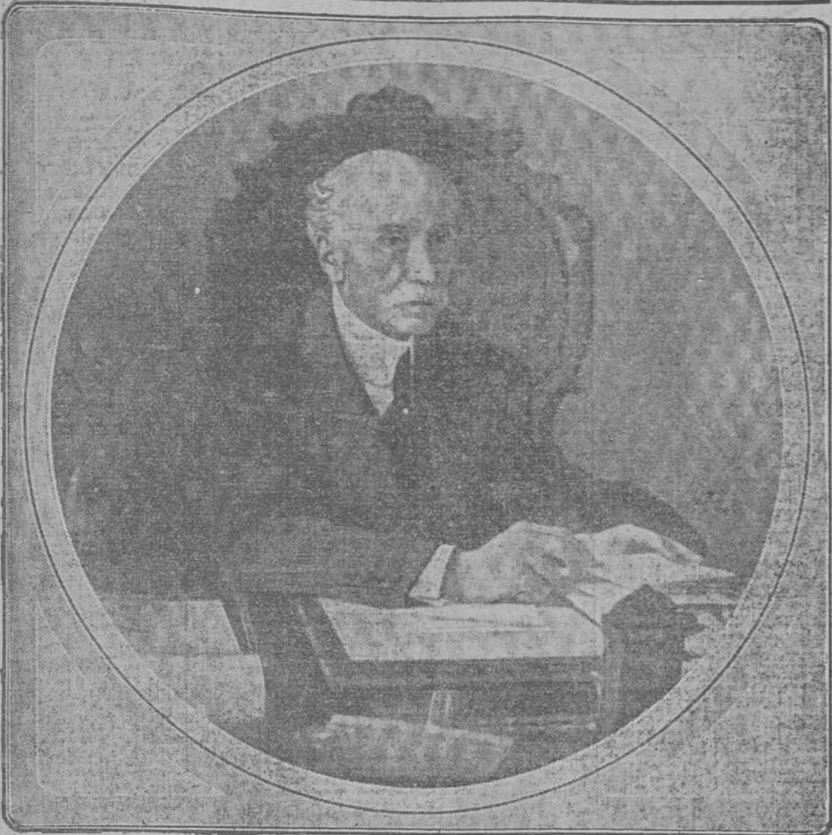
Excelentísimo señor don Eduardo Dato, gloria del foro, ilustre hombre público y actual Jefe del Gobierno

En el número 988 de esta revista, correspondiente al día 7 de Noviembre de 1912, honramos estas columnas publicando una larga carta del señor Dato, de la cual es preciso sustanciar lo siguiente: «La empresa acometida ahora por usted de traer a España, por medio de viajes de turismo y con precios muy económicos a miles y miles de compatriotas esparcidos por toda América, es algo tan extraordinario, que creo a usted acreedor a la gratitud más que al elogio. Plantea usted una cuestión, que es de verdadero interés público. Si a esos buenos españoles, llenos de fé en el engrandecimiento de la patria, los recibimos aquí con los brazos abiertos, como es nuestro deber; si los altos poderes del Estado, como ya se piensa, les dispensan atenciones y les otorgan facilidades para aproximarse y dejarse oír, se habrá realizado como por encanto la obra más fecunda y práctica de regeneración nacional.»