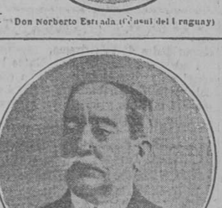
Don J. Roig y Bergadà (Senador). activísima propaganda, tiene a que las aspiraciones de unión, tantas veces pregonadas, obtengan una confirmación, al no definitiva, al menos en vías de realizarse. Nuestro aplauso sincero y espontáneo a esta entusiasta entidad, que dedica todas sus fuerzas a hacer efectiva la corriente de solidaridad entre las naciones que por lazos de tradición hablen el mismo idioma y mantienen el recuerdo latente del alma ibérica. Norberto Estrada. Sr. D. Gabriel R. España. Hemos de reconocer que España y la América latina constituyen una nacionalidad moral y que el Turismo Hispano-Americano es algo así como la circulación de la sangre en un organismo, y por tanto, la condición esencial de su existencia. No es posible emprender obra más patriótica que la que se propone el Turismo Hispano-Americano. Rafael Torromé