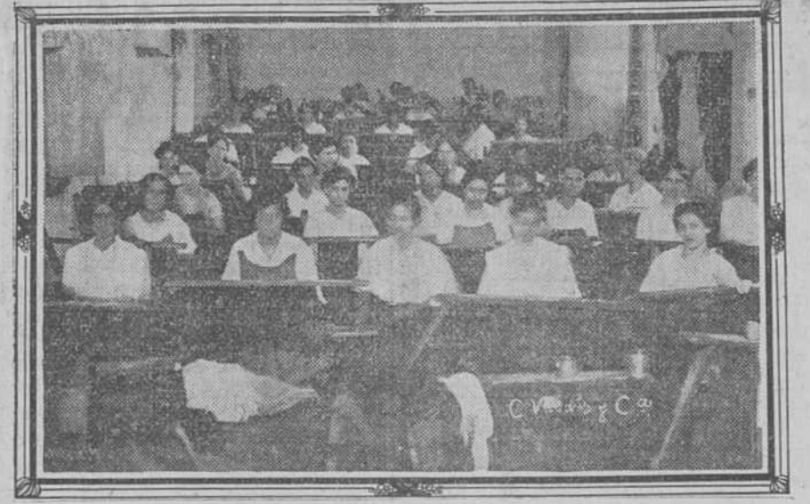
ARTEMISA.—Taller de tabaquería de la sucursal de "Romeo y Julieta." Departamento de mujeres.