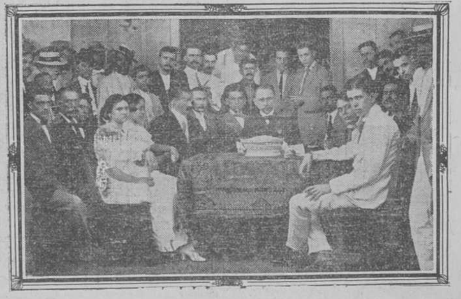
ARTEMISA.—Taller de tabaquería de la sucursal de "Romeo y Julieta."