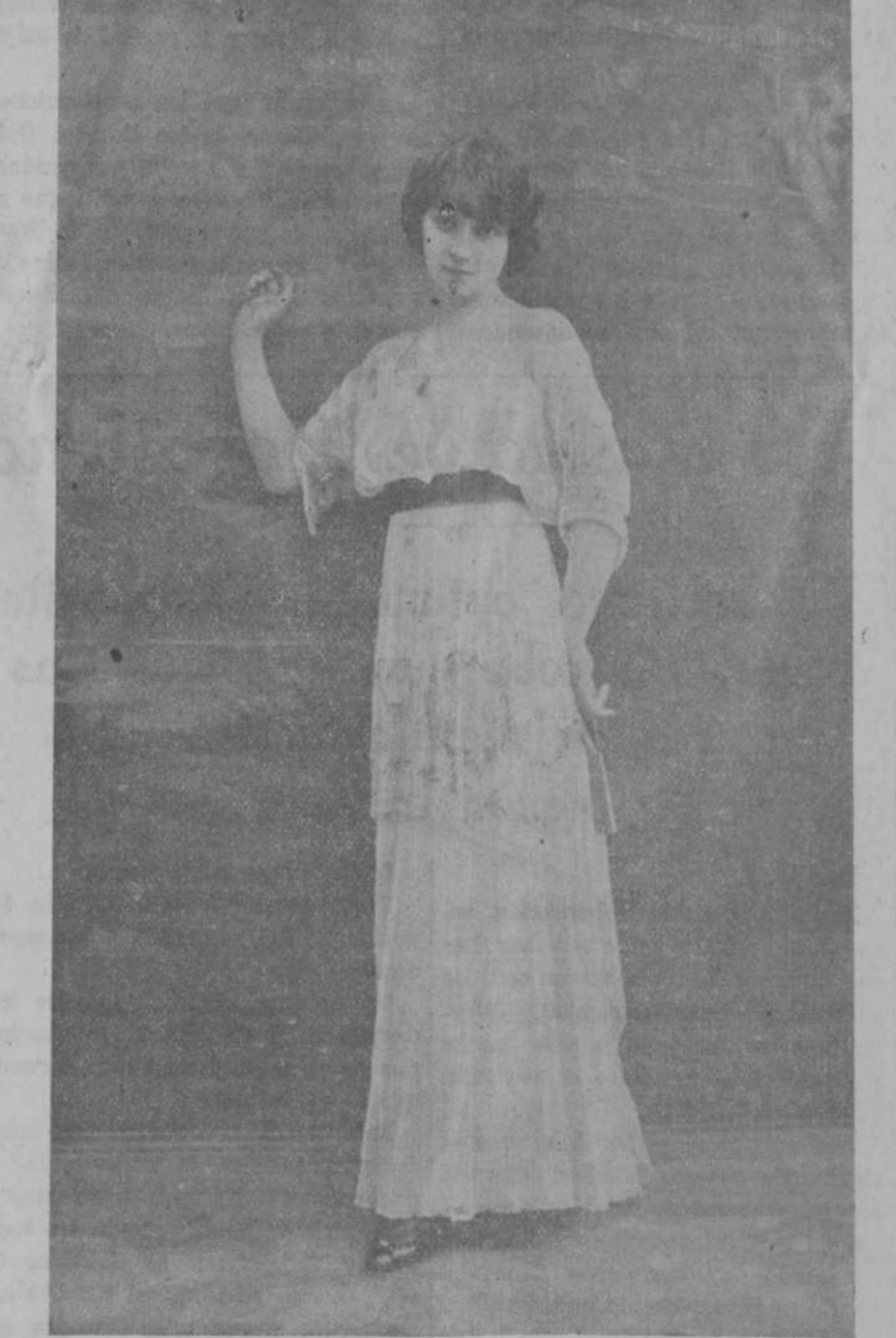
SENCILLO Y ELEGANTE TRAJE, PROPIO PARA JOVENCITA. MODELO DE BUZENET

Para impedir que las velas goteen se untan con una solución de Agua. . . . . 500 gramos Sulfato de magnesio. . . . . 16 " Dextrina. . . . . 5 "