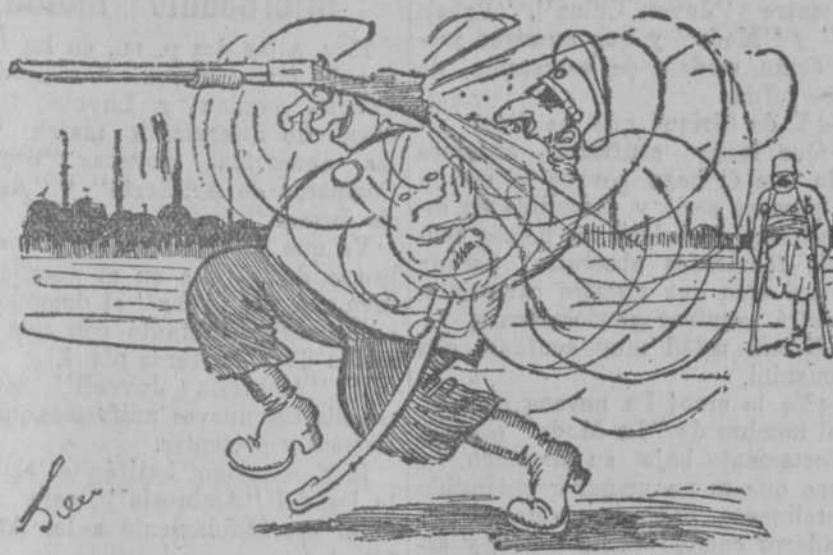
¡Le ha salido el tiro por la culata!