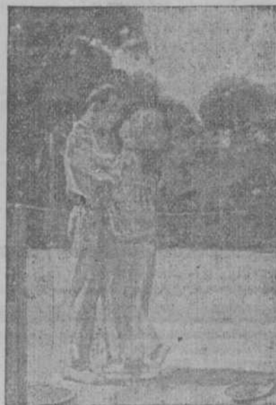
El resultado más práctico del juego.