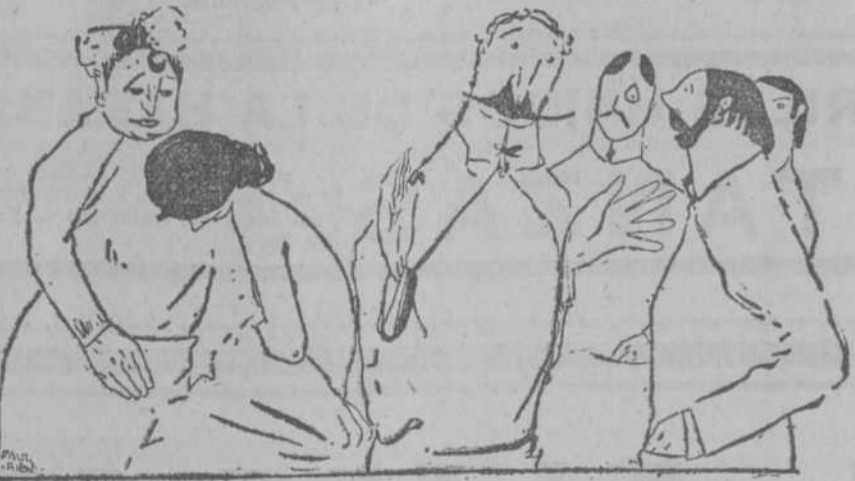
La eminencia.—Escuchen ustedes, señores... con ustedes, que van a ser mis colegas, debo ser franco... Cuando ausculto... no oigo nada. (Frou-Frou, de París.)