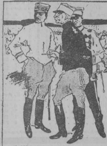
—Mañana, a las 8, continuaremos las maniobras. —Imposible, mi general: a esa hora celebran los soldados de mi regimiento un mitin para reclamar la desaparición de los ejércitos permanentes. (Lustige Blatter, de Berlín.)