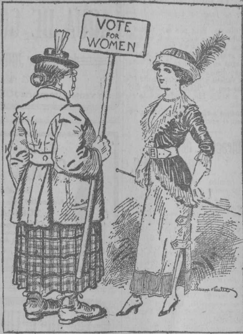
—¿La igualdad de los sexos? Pero, señora sufragista, yo perdería con el cambio, puesto que ahora tengo todos los hombres a mis pies. (Gacette de Hollande)