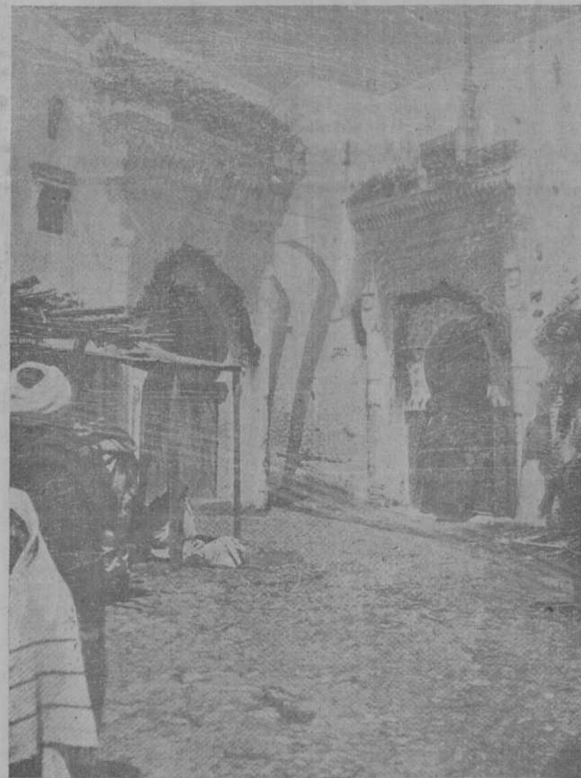
TETUAN PINTORESCO.—Mezquita del zoco El Foqui y de Sidi el Hach Ali el Baraca