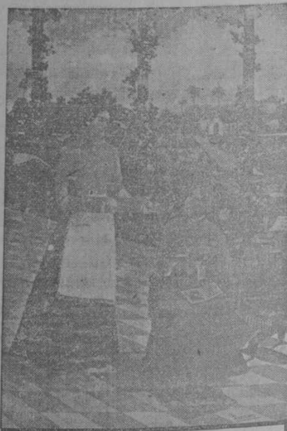
¡MIRE SEÑORA! ESTE ES EL JABON "LA LLAVE" que desde que lo uso, la ropa queda mejor y me deja las manos mas suaves