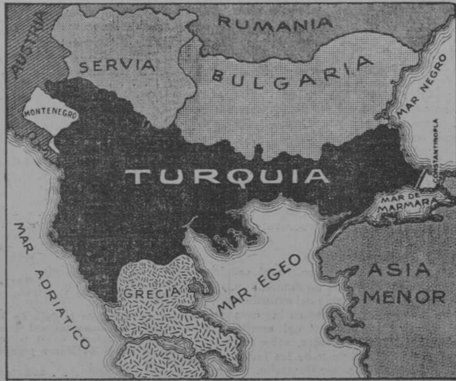
La parte negra indica lo que era el Imperio turco de Europa antes de comenzar la guerra y la parte blanca comprendida entre Constantinopla y la doble línea representa lo que queda en la actualidad al que fué poderoso Imperio Otomano. Esa doble línea son las fortificaciones de Chatalja, señaladas en mayor escala en el gráfico grande.

Están de plácemes los socios de "Vivero y su Comarca". Muy pronto llegará la fecha en que podrán disfrutar de un día en el que vendrán a sus