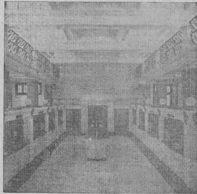
UNA VISTA INTERIOR

serva, con cuentas de depositantes por valor tan sólo de $155,900, cada año The Trust Company of Cuba ha repartido el 6 por 100 de intereses y ha ido aumentando su fondo de reserva, hasta $150,000 que aparecen en su balance último, ascendiendo el importe de sus depósitos, en fin del año 1912, a la respetable suma de $4,442,000, sin contar las inversiones que acaba de hacer en su gran palacio.