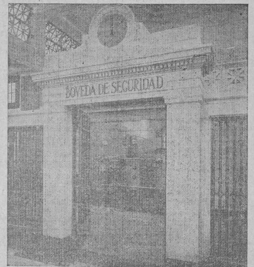
VISTA DE LA BOVEDA DE SEGURIDAD

Es un ejemplar realmente notable, cuya instalación sin duda alguna ha de tener un éxito inmediato, pues viene a llenar una necesidad en esta ciudad. Revíste esa obra un interés especial por ser la primera Bóveda de Seguridad de su clase