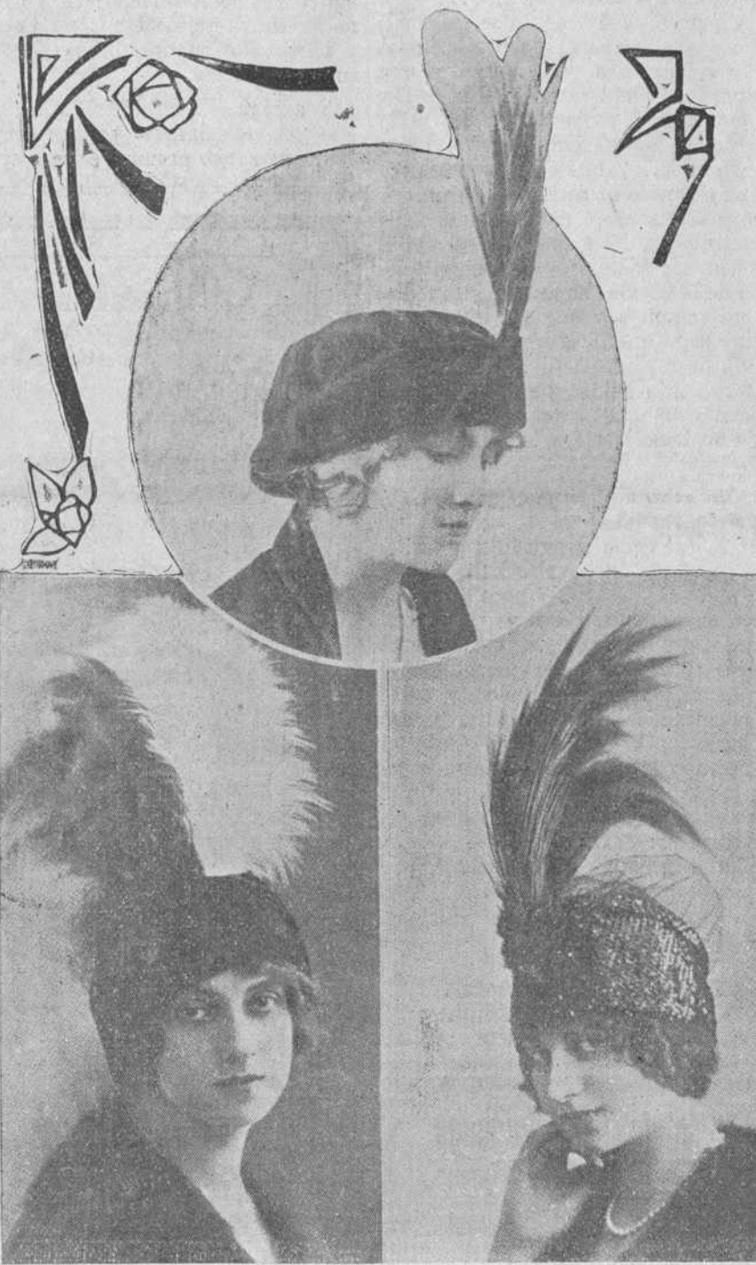
Sombrero de terciopelo negro con paradis.—Sombrero de terciopelo negro y aigrette.—Sombrero de tul negro con paradis.

En cuanto al paraguas, su forma es la de una sombrilla, pero objeto de necesidad más que de adorno, se hace siempre de seda negra impermeable, para librarnos de la lluvia. Es poco bello, y sólo en el puño de Eibar, o de lindos desmesquinos, incrustados o mosaicos conspícuo lucir el gusto de la dueña.