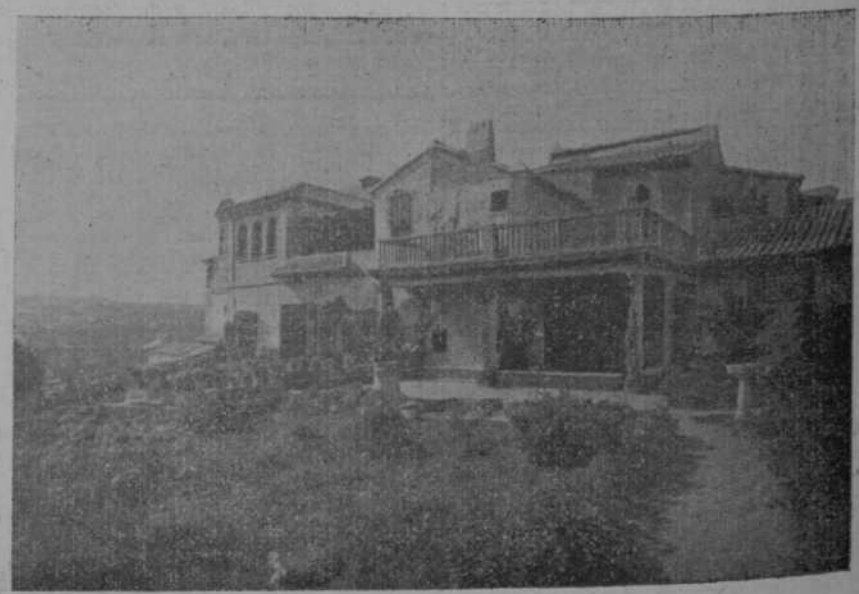
Entrada principal de la casa del Greco