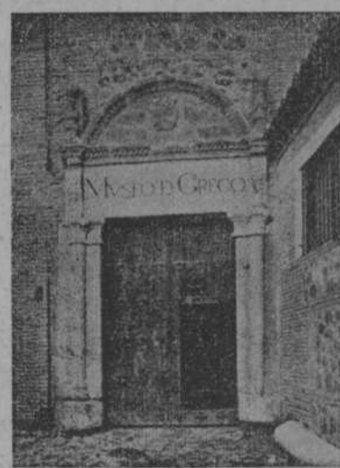
Entrada al Museo de el Greco

"En este tiempo vino de Italia un pintor llamado Dominico Greco: dicese era discípulo de Tiziano. Este tomó asiento en la muy celebrada y antiquísima ciudad de Toledo; trajo una manera tan extravagante, que hasta hoy no se ha visto cosa tan caprichosa, que pondrá en confusión a cualquiera bien entendido para discernir su extravagancia, porque son tan disonantes unas de otras, que no parecen ser de una misma mano. Entró en esta ciudad con grande crédito, en tal manera, que dió a entender no había cosa en el mundo más superior que sus obras; y de verdad, hizo algunas cosas dignas de mucha estimación, que se puede poner en el número de los famosos pintores: fué de extravagante condición, como su pintura; no se sabe hiciese por concierto cosa alguna de sus obras, porque decía que no había precio para pagarlas, y así a sus dueños se las daba por empeño, y sus dueños, con mucho gusto, le daban lo que les pedía; ganó muchos ducados, mas los gastaba en demasiado ostentación de su casa, hasta tener músicos asalariados para cuando comía, gozar de toda delicia. Hizo muchas obras, y la riqueza que dejó no fué más que doscientos cuadros principados de su mano: llegó a crecida edad, y siempre con la mismitirte que en el espacio necesario para pintar esta obra y las que ya había ejecutado, no pudiera entenderse fácilmente con los toledanos. Este ex-