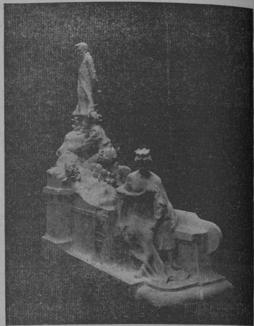
Proyecto de monumento a Alvaro González, muerto en el Zoco de Beni-Sicar, en la última campaña de Africa. Obra del joven escultor asturiano Restituto del Canto.

Este hecho tan anormal en los años artísticos de unos tiempos en que, pintor era sinónimo de cortesano, de-