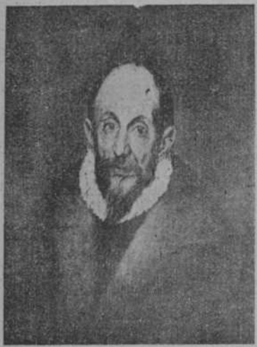
EL GRECO por el mismo