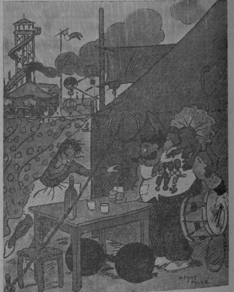
—¿Qué sucede? —Nos hemos fastidiado. El que nacia de mujer barbuda ha tenido un disgusto con el empresario del circo, y se ha afeitado.

—No lo sé. —Pues lo he ganado yo. —Bien merecido lo tenías.