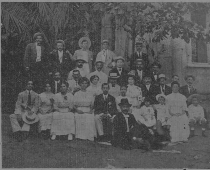
PRIMOROSO GRUPO DE ROMEROS Y ROMERAS EN LA MISMA JIRA