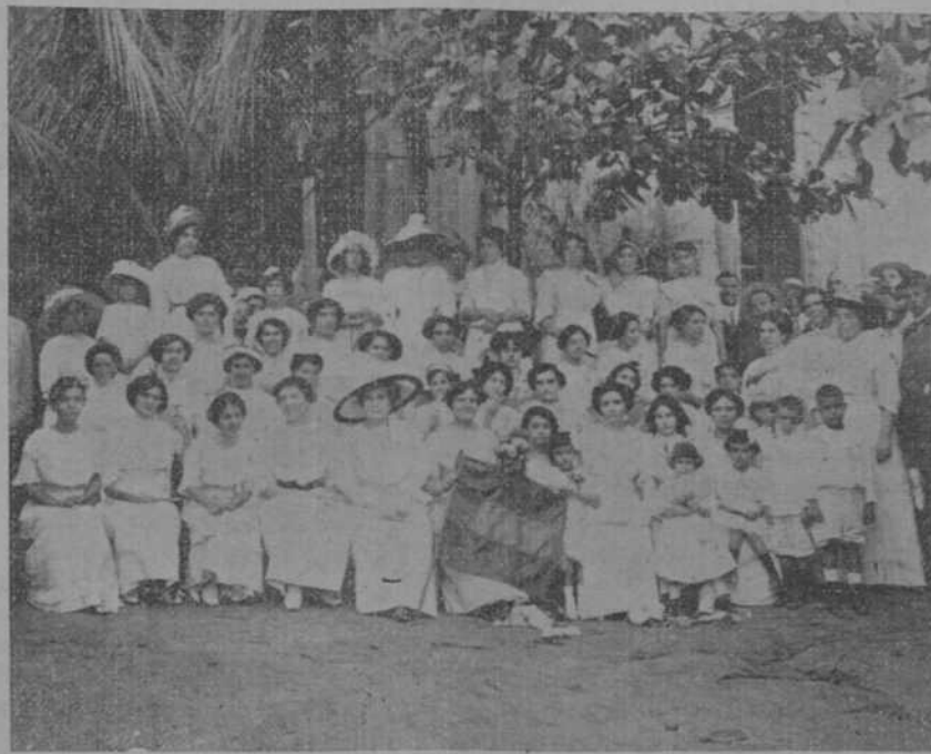
DAMAS Y DAMITAS EN LA JIRA DEL CLUB ESTRADENSE

Los estradenses que son gallegos y que fueron los primeros en constituir su club, llegaron ayer nadando al jardín de las fiestas españolas: pero llegaron. Y después de secarse al sol penetraron bajo la sombra del árbol abuelo. ¿Para qué?