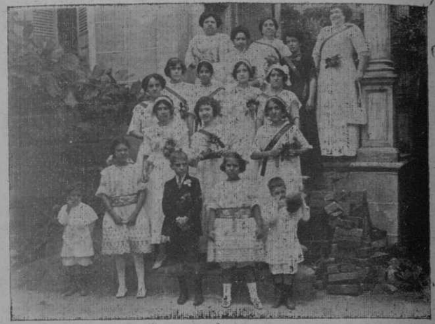
GRUPO DE SEÑORAS, SEÑORITAS Y NIROS EN LA JIRA DEL CLUB OVENTENSE