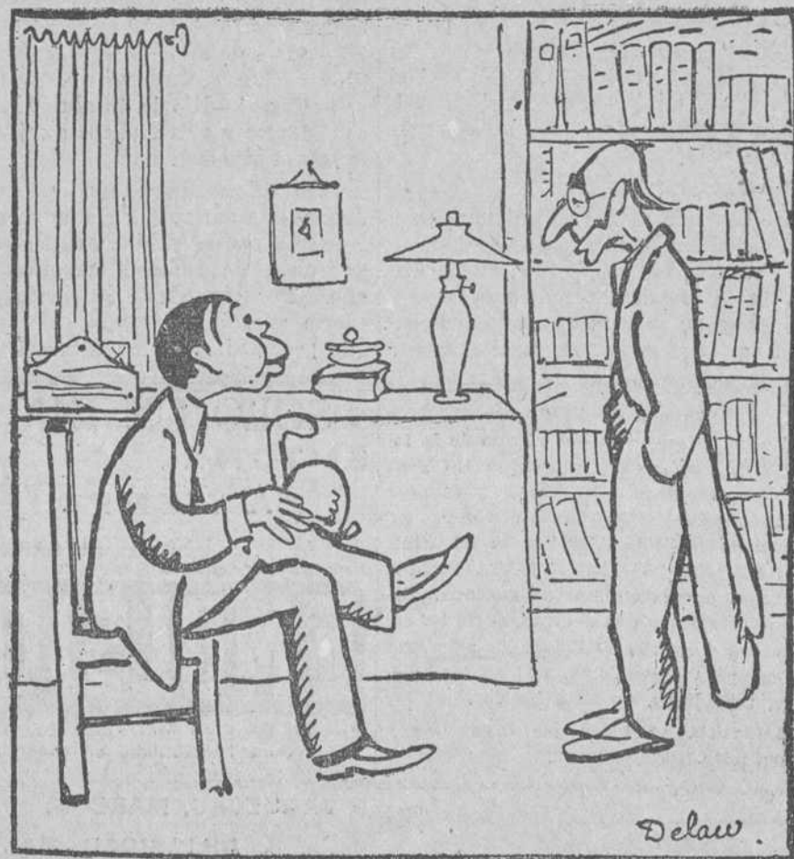
—No sé lo que me pasa, doctor. Siempre que acabo de comer se me enrojecen la cara.

—Vaya, lo que usted tiene es una enfermedad vergonzosa.