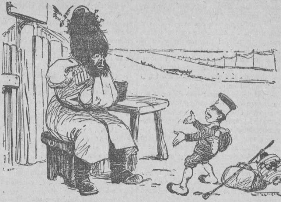
El japonés.—¡Ea! ¡Olvidemos lo pasado y démonos la mano!