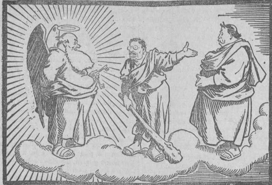
Roosevelt.—Señor San Pedro, si usted deja entrar a Taft en el Cielo, la Corte Celestial se convertirá en una guarida de caciques.