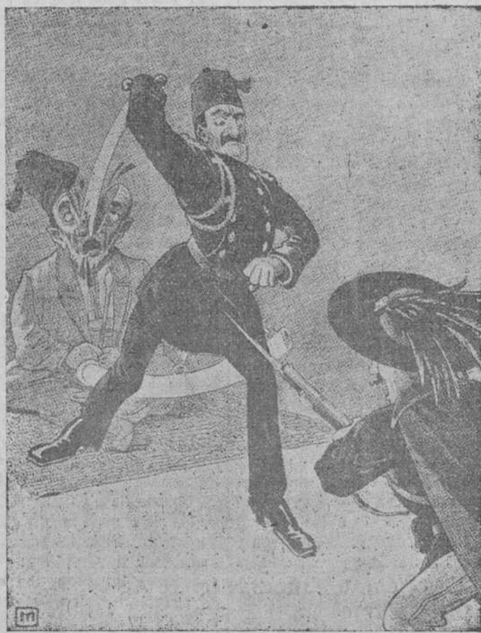
Los turcos dividiendo la patria con una guerra civil, en los momentos en que los ataca el extranjero.