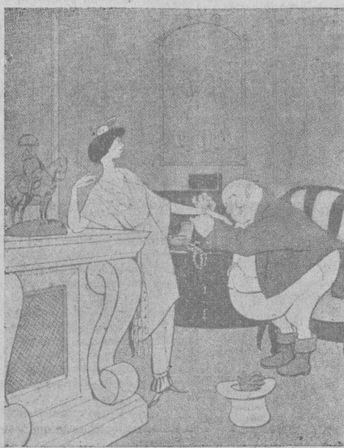
FRANCIA.—¡No seas tan ruin, viejito! A mí no se me conquista de balde. John Bull.—Ya lo sé Marlana. Por eso seré generoso; pues con tu amistad economizo varios dreadnought contra la maldita Alemania.