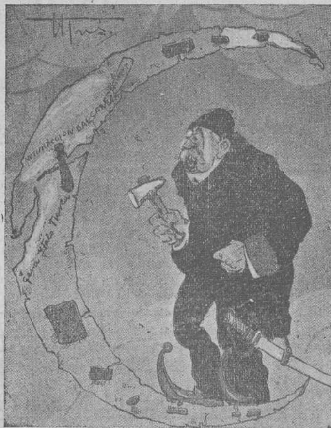
—¡Grande Alá, haz que las dos resquebrajaduras no se unan!