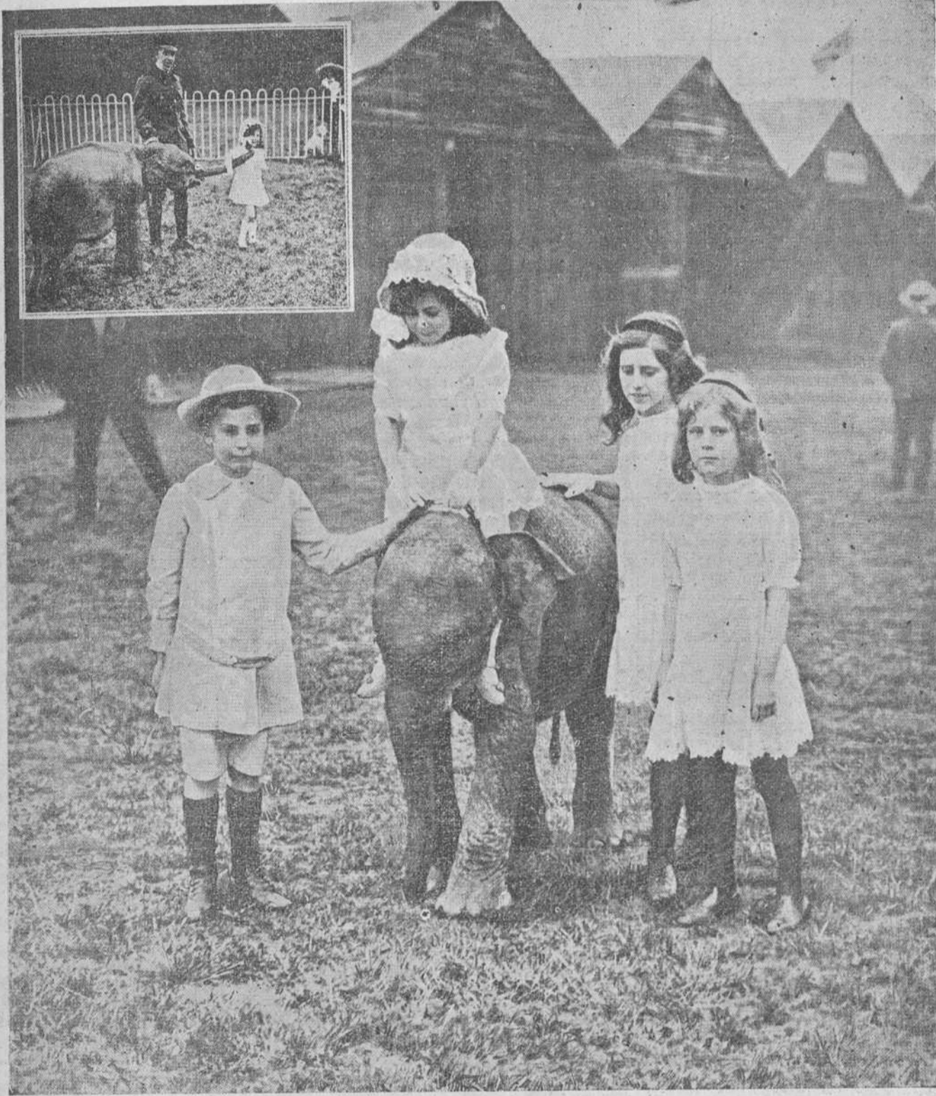
"JUMBO" EL ELEFANTE ENANO

Un elefante enano, perfectamente proporcionado, ofreciendo, en miniatura, todos los caracteres de los más grandes, de los más imponentes paquidermos, que se deja guiar dócilmente por los niños y que una muchachita, apenas más alta que él, conduce por el extremo de la trompa sin oponer la menor resistencia; tal es el espectáculo, poco corriente seguramente, que ofrece la fotografía que publicamos. "Jumbo"—que así se llama este elefante en miniatura—ha conquistado, desde hace algún tiempo, cierta celebridad en Inglaterra. No porque sea un animal de feria, que se lo disputen los empresarios, ávidos