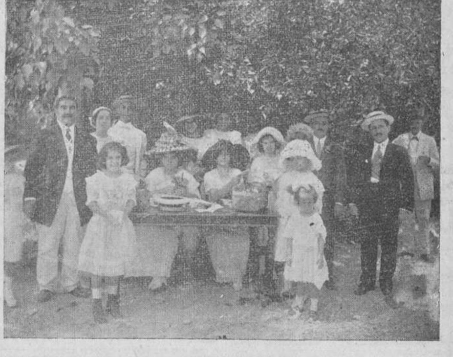
EL CLUB CUDILLERO: LA MADRINA Y VARIAS SEÑORITAS Y DIRECTIVOS RECIBIENDO A LOS ROMEROS