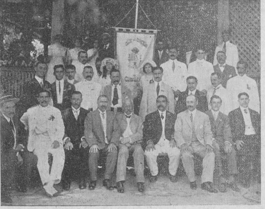
DIRECTIVA DEL CLUB CUDILLERO