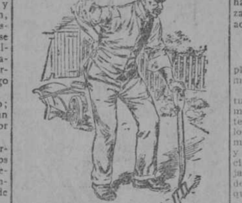
"El Sitio Mas Vulnerable de mi anatomía."

Las Píldoras de Foster para los Riñones traen pronto alivio a los riñones. No hay que perder el tiempo, la salud y el dinero en experimentos con otros remedios de reputación dudosa. Las Píldoras de Foster cuentan 75 años de éxito no interrumpido en la curación de afecciones dorsales, de los riñones y de la vejiga.