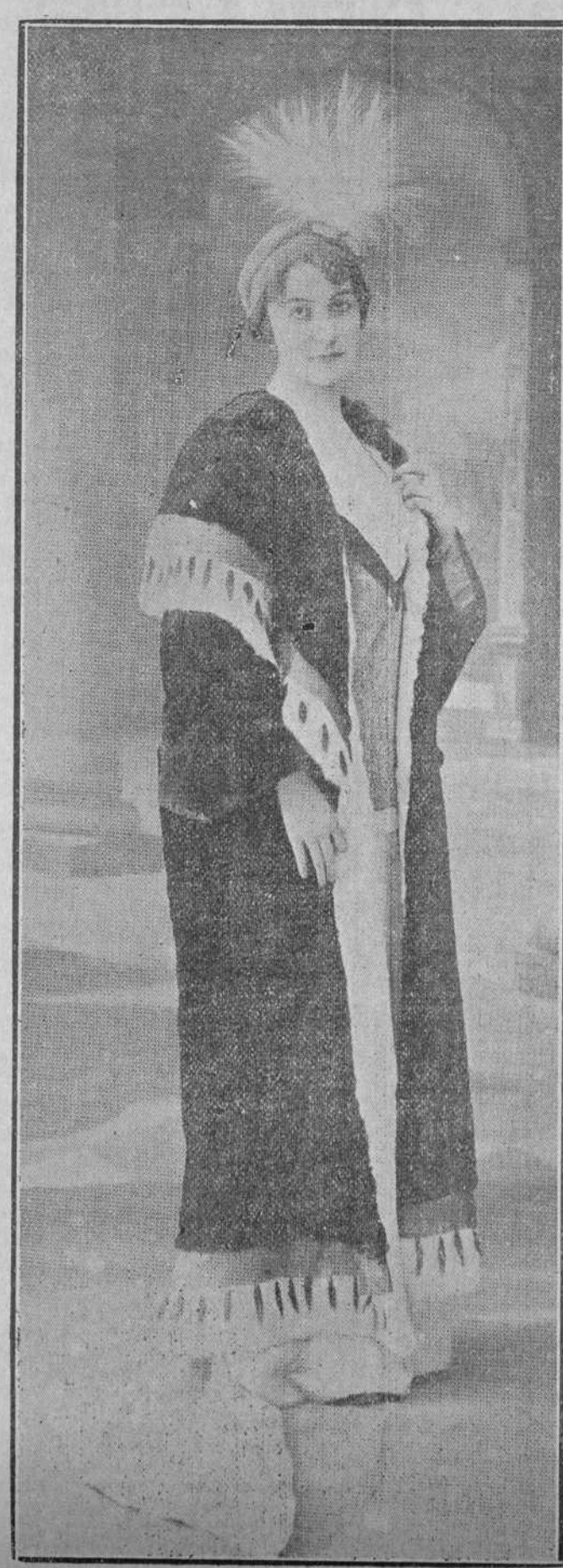
Abrijo para teatro, todo de piel de nutria, de Hudson, guarnecido de armiño. Este bonito modelo Bechoff-David, es propio para la estación invernal que se aproxima.