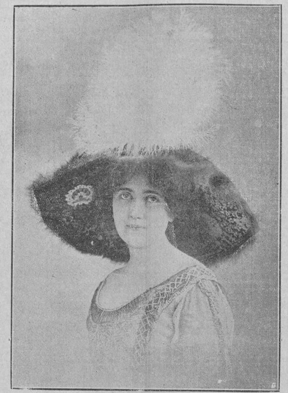
Sombrero de fieltro adornado con tres volantes de encaje de oro; lleva forro de brocado con flores color oro viejo y va guarnecido con una hermosa pluma blanca en forma de penacho. Este lindísimo modelo es de Alphonse.