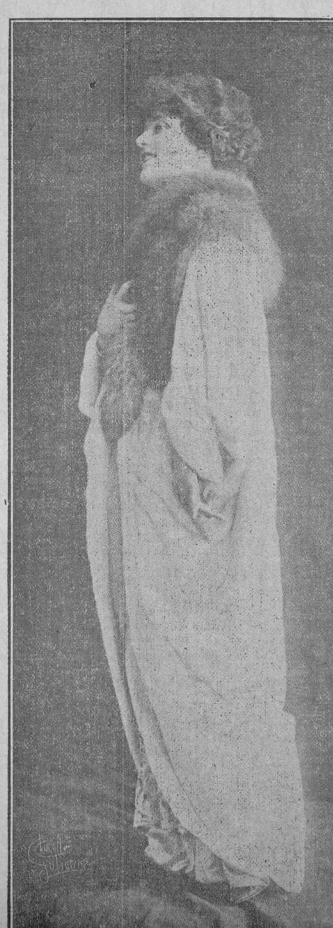
Abrijo para teatro que ha llamado mucho la atención en París. Es de riquísimo armiño con cuello de piel de zorra azul.

Y hoy, llevando por guía el desaliento, escondiendo en el alma el sufrimiento, baja la frente porque fué vencido, por tenebrosa senda toda abrojos, avanzo inmensamente dolorido...; y leuántas veces póstrome de hinojos, y elevó á tí con humildad los ojos suplicando piedad, que estoy perdido... E. R.