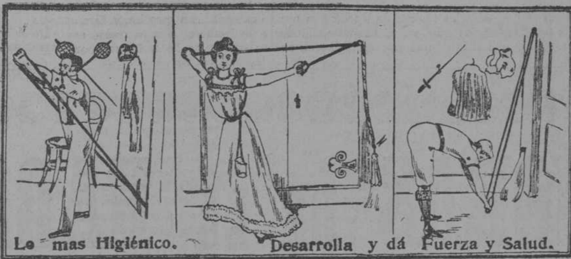
Le mas Higiénico.

OPTICA, ARTICULOS DE ESRIMA Y GIMNASIA ESPEJUELOS Y LENTES DE TODAS CLASES PIEDRAS DEL BRASIL CRISTALES AHUMADOS DE TODOS LOS GRADOS ANTEJOS Y GEMELOS PARA CAMPO, TEATRO Y MARINA