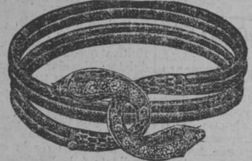
Pulsera serpiente, en oro, con brillantes y piedras de co- lores.

Longines extra-planos, en acero, plata, plata nie- lé y oro, para caballeros. Admirables cajas con es- maltes, muy finos