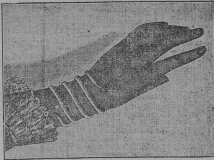
Pulsera serpiente en oro solo.