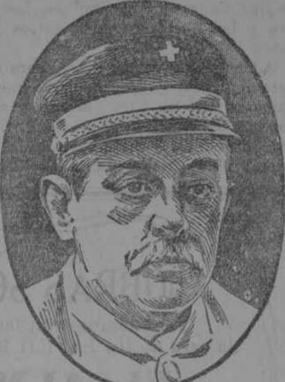
La Emulsión de Angier curó á este hombre de una afección pulmonar.

¿Por qué Cuba deja perder lo que allí nace?