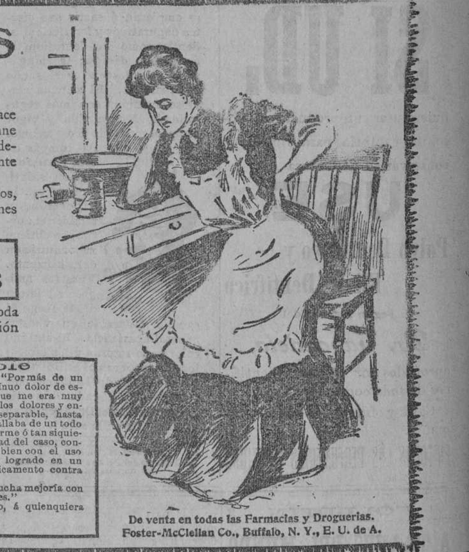
De venta en todas las Farmacias y Droguerías. Foster-McClellan Co., Buffalo, N. Y., E. U. de A.

NOTA: Enviaremos una muestra gratis, franco porte, desde Buffalo, á quienquiera nos escriba solicitándola.