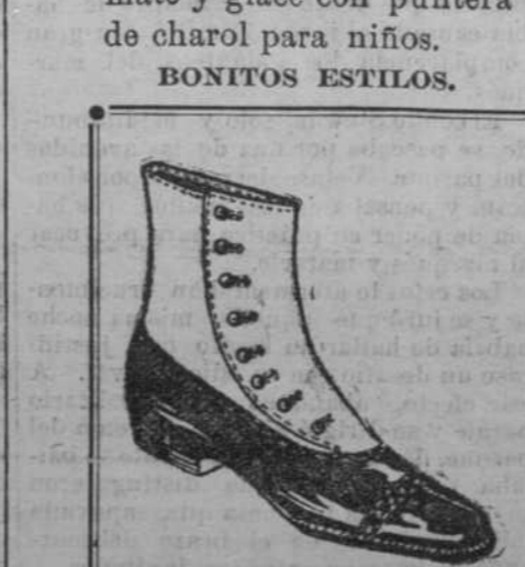
Polacos charol glacé y mate y glacé con puntera de charol para niños. BONITOS ESTILOS.