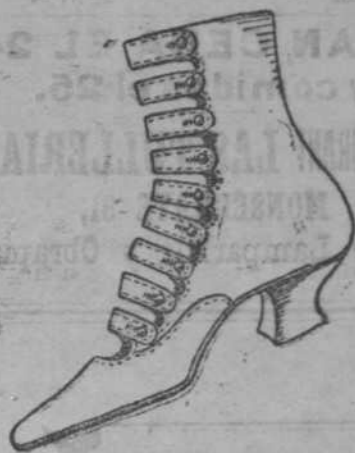
C 2245 alt 44-5Db

TRAJES DE CASIMIR para jóvenes de 12 a 18 años, a 3 pesos plata, en LA GLORIETA CUBANA. San Rafael 31. Teléfono 1763. C 2422 61-21 1m-25