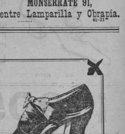
Polacos charol glacé y mate y glacé con puntera de charol para niños. BONITOS ESTILOS.