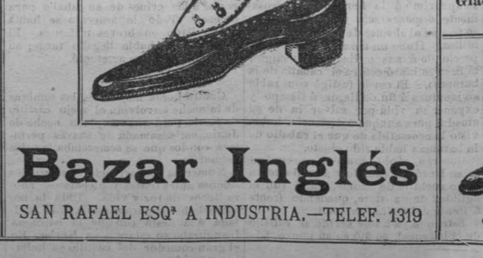
Polacos charol glacé y mate y glacé con puntera de charol para niños. BONITOS ESTILOS.

SE COMPRAN en ganga algunos armatostes, muebles usados etc. En Dragones 16 barbería. Informan de 3 á 9 de la mañana. 16017 12-19 12m-20 D