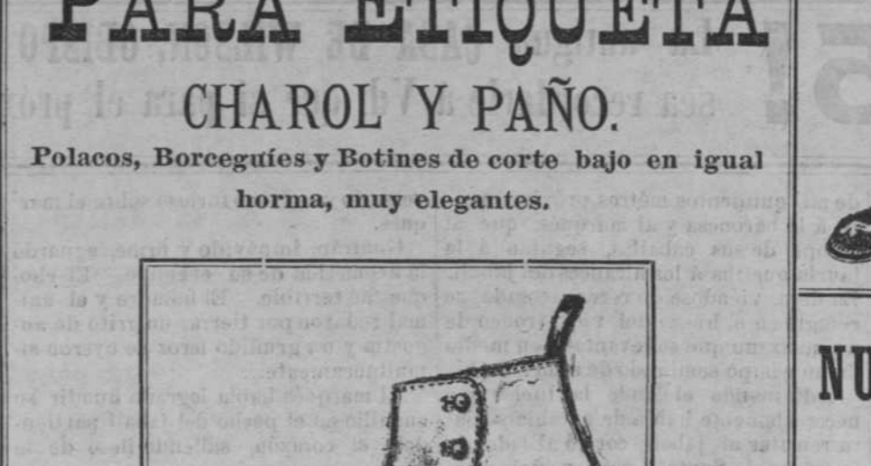
Polacos charol glacé y mate y glacé con puntera de charol para niños. BONITOS ESTILOS.

Polacos, Borceguíes y Botines de corte bajo en igual horma, muy elegantes.