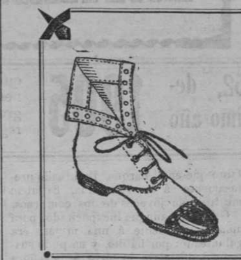
Polacos charol glacé y mate y glacé con puntera de charol para niños. BONITOS ESTILOS.

GRAN CENA EL 24 y comidas el 25. RESTAURANT LAS TULLERIAS MONSERRATE 91, entre Lamparilla y Obrapia. 41-21