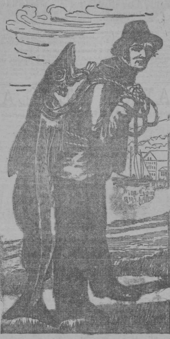
Cada frasco de la legítima lleva esta etiqueta.

de la genuina Emulsión de Scott, la que siempre ha curado y siempre curará. La Emulsión de Scott cura por la superioridad de los ingredientes en ella usados y por la manera como están combinados. Las medicinas baratas y las que nada cuestan hacen más daño que bien. El niño ó el adulto que tome la verdadera Emulsión de Scott recibe beneficio positivo de cada dosis. ¿De qué vale tomar un montón de botellas de medicina aunque se las regalen á uno, si lejos de curarse lo que se logra es empeorarse?