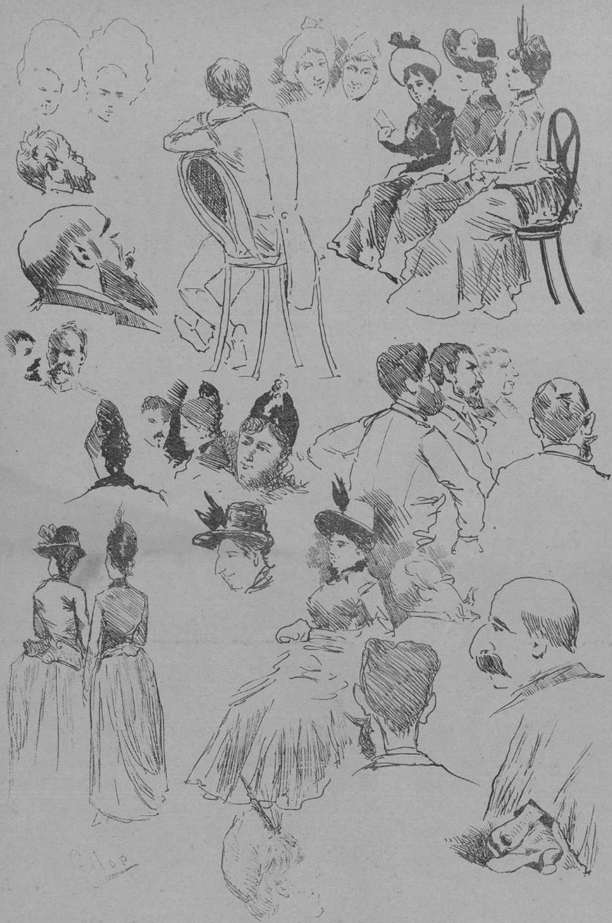
Impresiones del Concierto de Albeniz (En el Círculo Vitoriano)