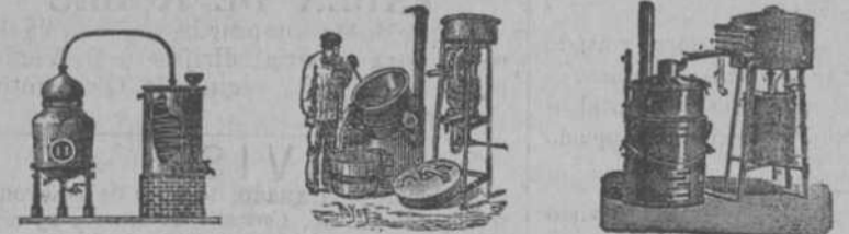
Alambique de vapor fijo é basculante para Licores, Perfumes y Extractos Alambique economizador de agua para destilar Orujos, Heces y Frutas. Facilidad de limpiar Alambique rectificador basculante, con calienta-vino.—De 80°. Rápidez y economía

CATALOGOS E INFORMES EN CASTELLANO, FRANCO