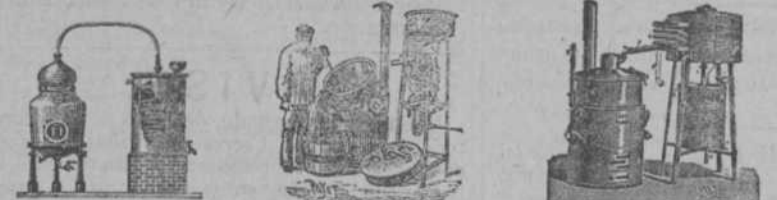
Alambique de vapor fijo é basculante para Lieores, Perfumes y Extractos Alambique economizador de agua para destilar Orzón, Haces y Frutas. Facilidad de limpiar Alambique rectificador basculante, con caliente-vino. - Da 80°. Rapidez y economía

CATALOGOS E INFORMES EN CASTELLANO, FRANCO