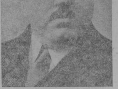
El Excmo. Sr. Ministro de Educación Nacional, D. Pedro Sainz Rodríguez

Don Raimundo Fernández Cuesta, pertenece al grupo de aquellos guerrilleros románticos, denodados, austeros, todos sacrificio y esperanza, gallardía y apostura, que en las jornadas difíciles del régimen nausabundo —aludimos a la nefasta y fenecida República— proclamaron lo ideal, lo poético y lo romántico, por encima de toda la marullera política. Nunca podremos olvidar, porque como ciudadanos sensatos y periodistas conscientes supimos consignarlo a su debido tiempo, aquel discurso so-brio y pujante, varonil y altivo que en la mañana del 17 de noviembre de 1935 pronunció este camarada valiente y preclaro que se llama Raimundo Fernández Cuesta. En tal discurso hizo un llamamiento a la juventud íntacta y silente de España, hoy vemos con estupefacción y laudable admiración como esa misma juven-