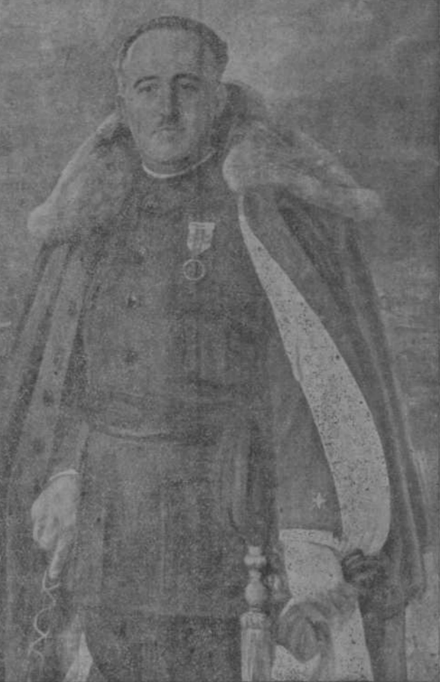
El Generalísimo Franco que ayer revisó la Escuadra en Vinaros

Terminó el ejercicio mariano del Mes de Mayo; todo español debe procurar que las flores de moralidad en él recogidas no se marchiten en su corazón, hoy más que nunca, para que su aroma embalsame la sublime realidad de nuestro ¡Arriba España!