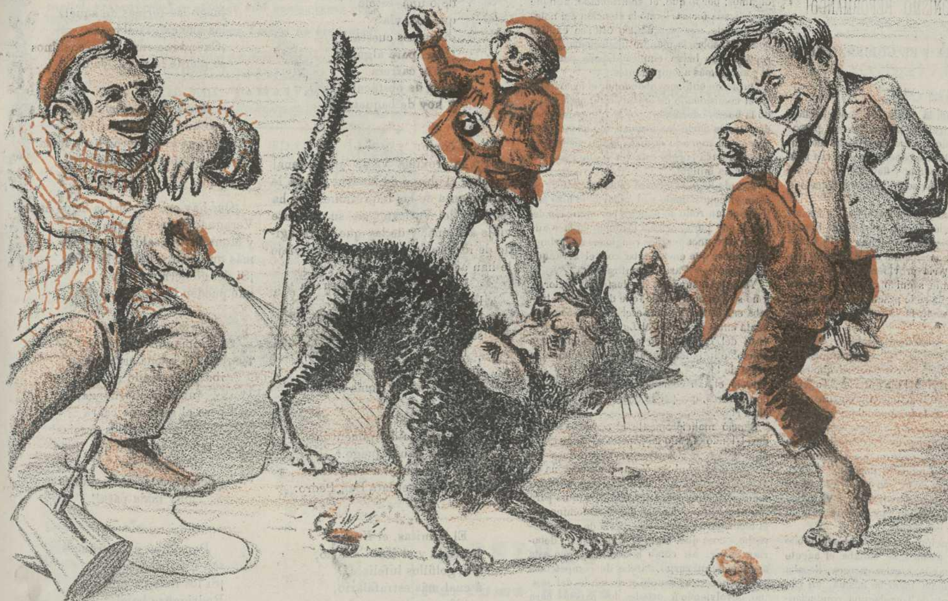
¡Pobre minino!—(Discursos de Soriano, Sagasta y Nocedal.)