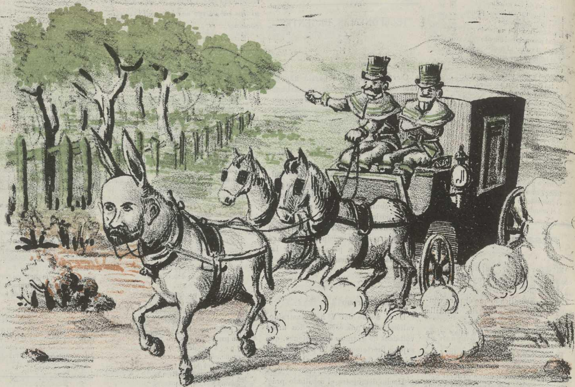
La Nota oficiosa.