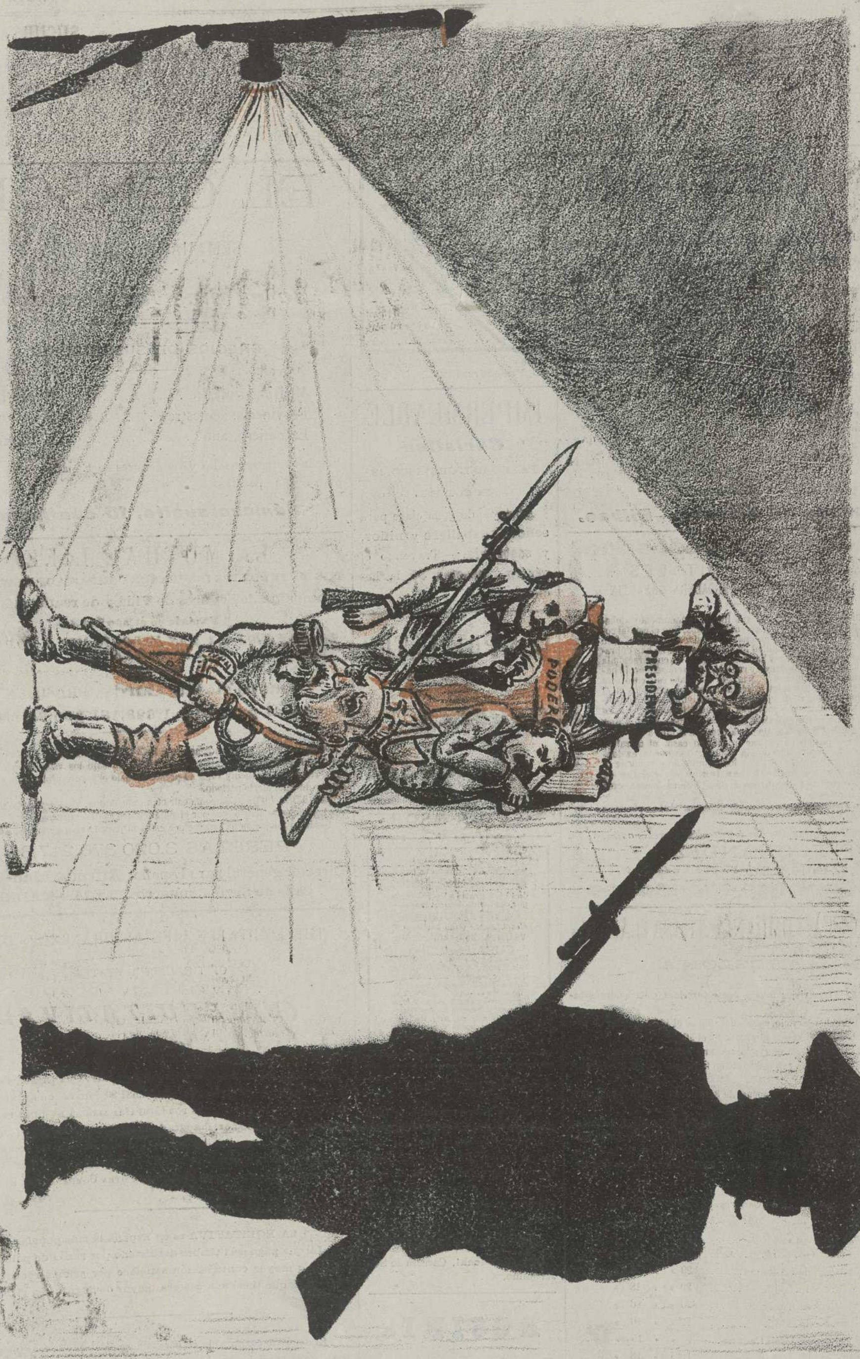
EL PARTIDO CONSERVADOR