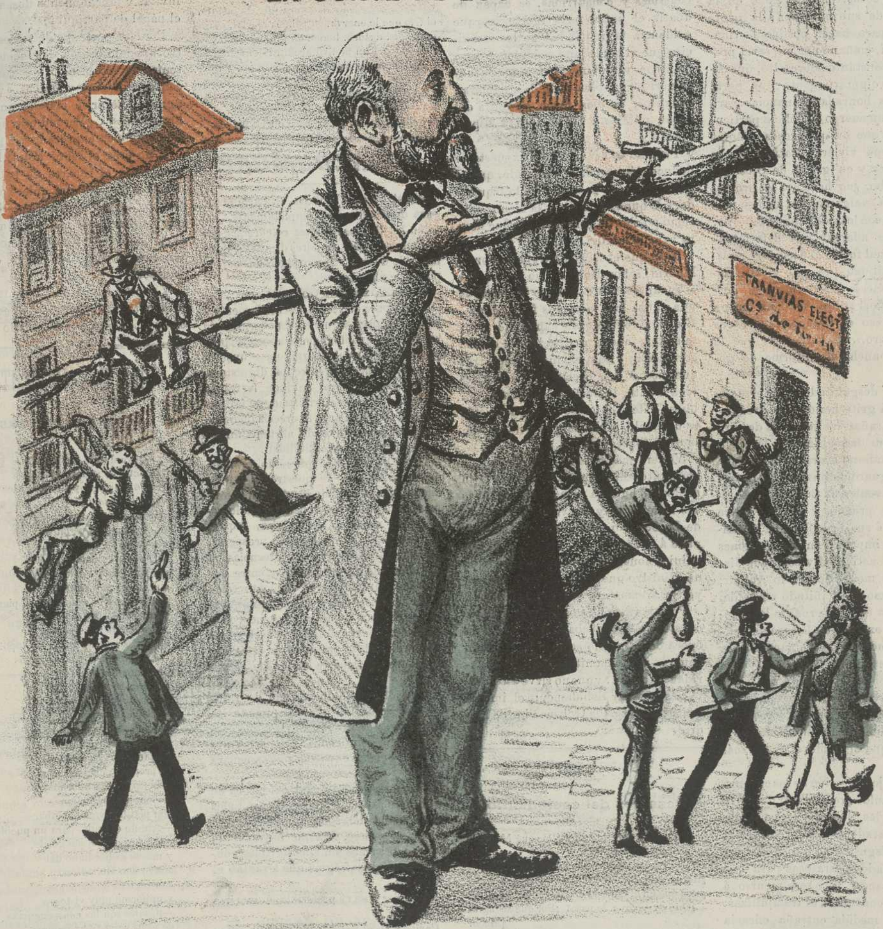
EL DIOS GRANDE