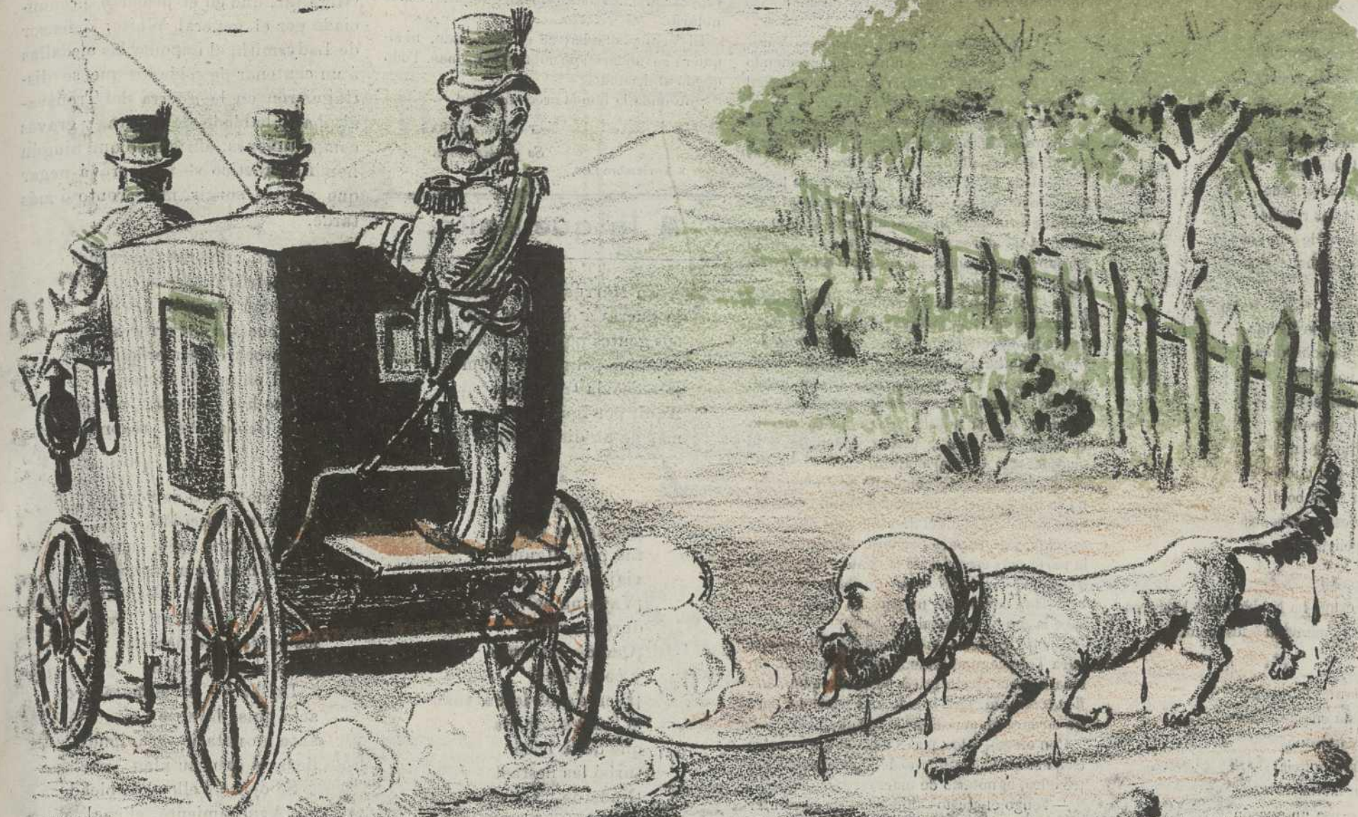
El discurso de Suarez Inclán.