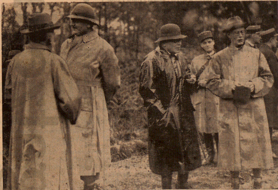
1.—L'Eminentíssim Cardenal Gasparri, que ha mort a Roma.