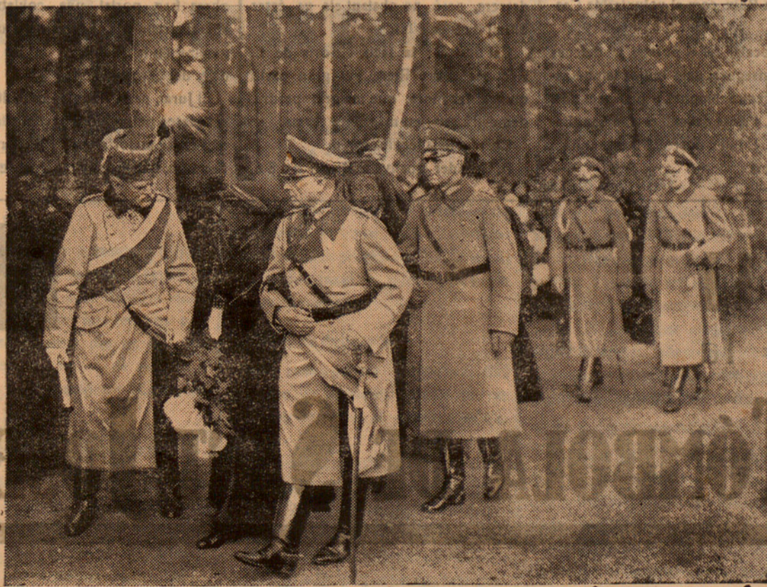
Ha tingut lloc amb gran cerimònia l'enterrament del General Alexander Von Kluck, en el cementiri de Stahnsdorf, situat en el bosc del mateix nom. En la fotografia velem el Mariscal de Camp Von Mackensen i el Generalíssim dels exèrcits alemanys General Von Fritsch, acompanyant la vidua del difunt general. El General Von Fritsch és una de les persones més preeminentes d'Alemanya, mereixent recordar-se la seva polèmica amb Hitler, en 30 de juny darrer.