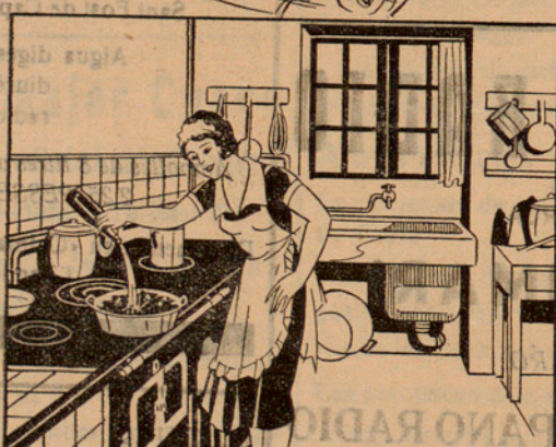
Amb la solució preparada mulló 15 quilos de carbó que abans hauré posat en un cubell, fins que quedí ben mullat. ¡Qüestió d'un minut!