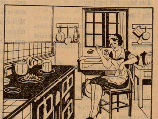
¡Quina felicitat! Més calor a la cuina, més netedat a la llar... ¡AIXO ES IDEAL!

Aplicable a tota classe de carbons: Hules, Antracites, Cok, Alzina, Roure i demés vegetals La casa productora garanteix la seva eficàcia; si vostè compra un pot i no obté el resultat, avisi immediatament per telèfon i li adreçarà un empleat a subsanar el defecte d'aplicació.