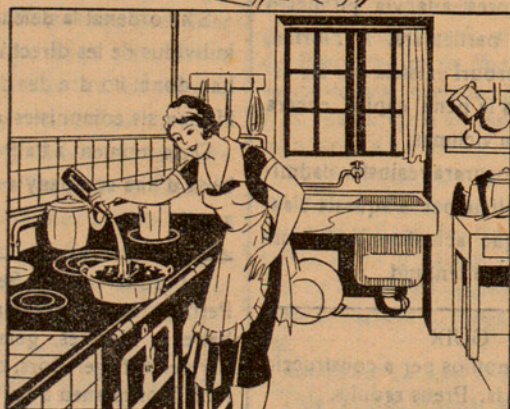
Amb la solució preparada multo 15 quilos de carbó que abans hauré posat en un cubell, fins que quedi ben mullat. ¡Qüestió d'un minut!