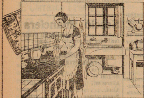
En una botella de litre plena d'aigua, hi poso dues cullerades de Oxigenante de Carbones i remeno la botella... ¡JA ESTÀ!

Vegi gràficament la manera senzilla i pràctica de preparar el carbó, només un minut cada dia