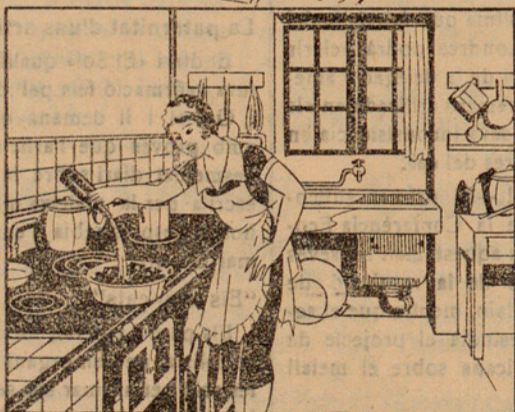
Amb la solució preparada mullo 15 quilos de carbó que abans hauré posat en un cubell, fins que quedí ben mullat. ¡Questió d'un minut!